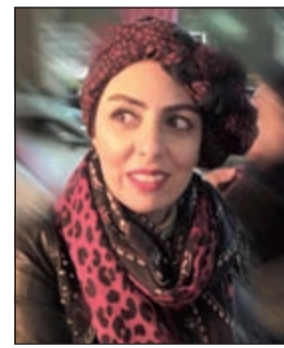
الكتابة هبة مندني

في قلوب الناس جميعا. وهذه القصة تحكي حكاية زهرة تعيش في بستان مليء بالزهور التي تحب بعضها، لكن زهرة واحدة، وهي زهرة النرجس كانت تشعر بأنها أجمل الزهور، وكانت تنظر إلى الزهور الأخرى باستعلاء، وتقول «أنا من ستفوز بلقب الزهرة الأجمل، أنا الأجمل بين الزهور، فما أجمل لوني الزاهي، وما أزكى شذائي». وكانت الأزهار الأخرى تنصحها بأن تتواضع، لأن جميع الأزهار جميلة، لكنها كانت مزهوة بجمالها، فأنزعجت منها سائر الزهور، فجاءت هاجمت البستان مجموعة من الجرذان، وكاد جرد يفتك بزهرة النرجس لولا مساعدة صديقاتها الزهور. وفي نهاية القصة تحدث مفاجأة غير متوقعة مذهلة وجميلة، ومليئة بالفرح، تؤكد أن كل الزهور كانت تحب بعضها بعضا، فهل هنالك ما هو أجمل من أن ننشر المحبة والرحمة والتآلف فيما بيننا.. يا أجمل الأصدقاء؟