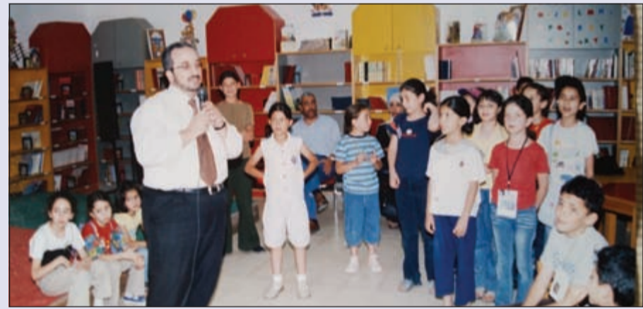
الشاعر محمد جمال عمرو ينشد شعره على الأطفال

في مجلات الأطفال التي كنت رئيسا أو مديرا لتحريرها، ومنها مجلة «أروى» في الثمانينيات، ومجلة «فراس» في التسعينيات، وفي مجلات أطفال عربية أخرى، وكذلك في ملاحق الأطفال في الصحف، وكتبت أغنيات كثيرة لشعارات أفلام ومسلسلات الكرتون العربية والمبلجة وغيرها