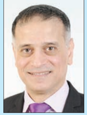
إعداد: د. طارق البكري

جميل أن نقرأ.. وجميل أن نفهم.. لكن الأجل أن نعمل بما نقرأ ونفهم.. نحن سعداء لأن كل ما حولنا جميل من نعم كثيرة نعيش في ظلها. نفرح ونمرح ونجد دائماً ما يسرنا. بفضل الله وعنايته. لذا، فإن هذا الفضل الكبير يستحق منا الشكر والأمتنان.. وبالشكر تدوم النعم.. فإله تعالي أنعم علينا بخير وفير. بدءاً من نعمة الحياة.. ثم نعمة الأسرة، ونعمة الصحة.. ولا ننسى نعمة الأمن والعيش بسلام. فيما يعيش كثير من الناس في حروب وخوف ورعب وجوع ومرض وفقر.. أما شكر النعمة فلها وجه كثيرة.. علينا أولاً أن نقدر قيمة كل نعمة نحن نعمة بها. فنعمتنا البصر والسمع – على سبيل المثال – نعمتان عظيمتان. مثل سائر النعم، لكننا أحياناً لا نقدر هذه النعم لأنها موجودة.. فإذا فقدناها عرفنا قيمتها.. وحتى تدوم النعم.. لا بد من شكر من أعطانا إياها، والشكر يكون بان نحافظ عليها ونستخدمها في الخير.. ولو فكرنا في نعمة اللسان والكلام.. فيجب أن نستفيد من لساننا بالكلام الحسن الطيب. وليس بالكلام السيئ والمشاحنات والجدال غير المفيد.. وكذلك نعمة البصر.. فلا ننظر إلى الأشياء التي لا يبرينا الله أن ننظر إليها.. أما نعمة الوقت فلها حديث طويل.. ويكفي أن نعلم أن الوقت إذا ذهب فإنه لا يعود.. شكراً للمنعم على نعمته التي لا تحصى.. وهو القائل: (وإن تعدوا نعمة الله لا تحصوها).. مع محبتي لكم.. وبمكتكم مرسلتي على الإيميل التالي: DOCBAKRI@YAHOO.COM