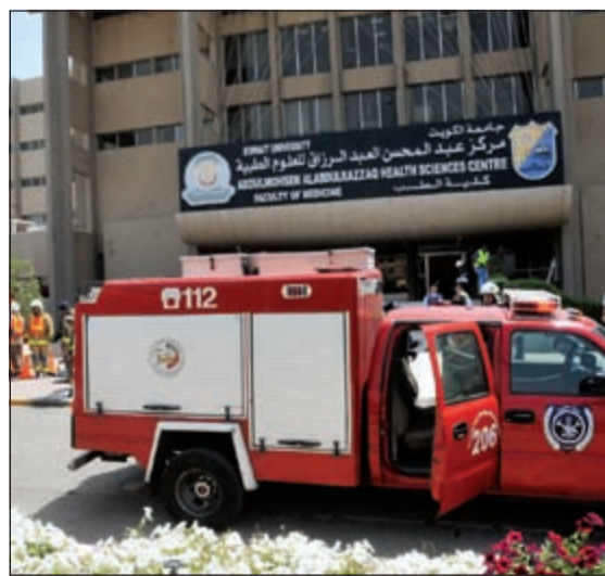
سيارات الدفاع المدني في موقع الحريق