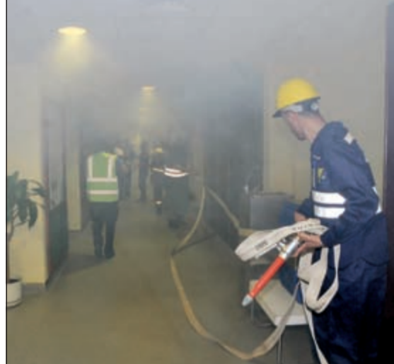
مكافحة النيران بخراطيم المياه (محمد هاشم)