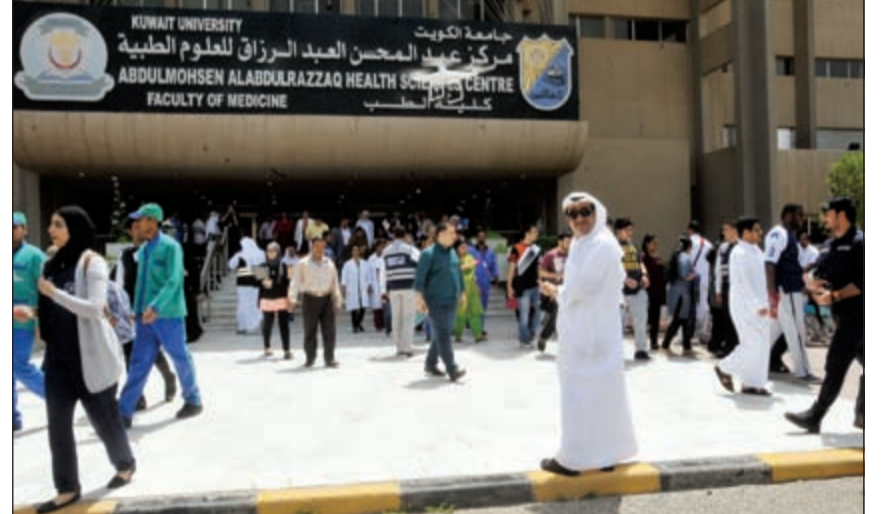
إخلاء المبني من الطلاب والموظفين

وفايا و623 طالبا وطالبة، بالإضافة إلى إنقاذ الحالات المصابة وإخراجها من مكان الحادث، حيث تضم كلية الطب 8 أنوار و24 قاعة دراسية و118 مختبرا و3 سالام طوارئ و3 مصاعد و9 أبواب طوارئ. والجدير بالذكر أن سيناريو الإخلاء الوهمي بدأ بانطلاق حريق داخل المبني وانتشار الأدخنة مما أدى إلى انطلاق صافرات الإنذار وحدوث إصابات، حيث قامت الإدارة العامة للإطفاء بالسيطرة على الحريق