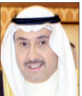
الشيخ فيصل الحمود

العزاب، مشددا على تطبيق القانون بحزم على الجميع دون استثناء بما يسهم تحقيق تطلعات آمال المواطنين.