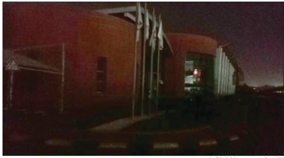
المكتب الرئيسي بعد إطفاء الأنوار