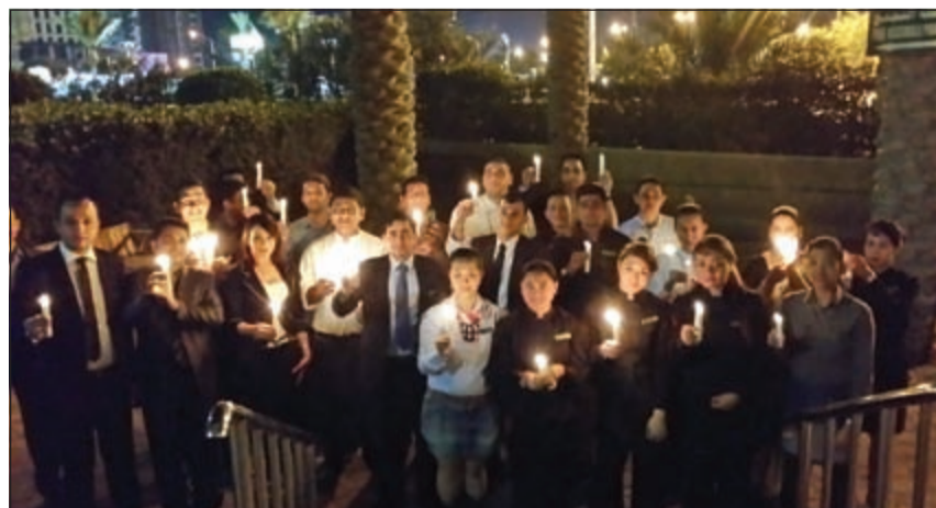
إضاءة الشموع في «هوليداي إن السالمية»

حيث يتم تسليمها الى الجهات المتخصصة في ذلك. وناتسي هذه المبادرات لتعكس التزام جميع العاملين في فندق هوليداي إن في الوقوف جنباً الى جنب نحو العمل على خلق مستقبل أكثر إشراقاً لكوكب الأرض.