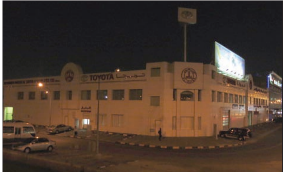
معرض الغزالي أثناء المشاركة في ساعة الأرض

في يومنا هذا، تتمثل ساعة الأرض بمشاركة مختلف قطاعات المجتمع في ابداء