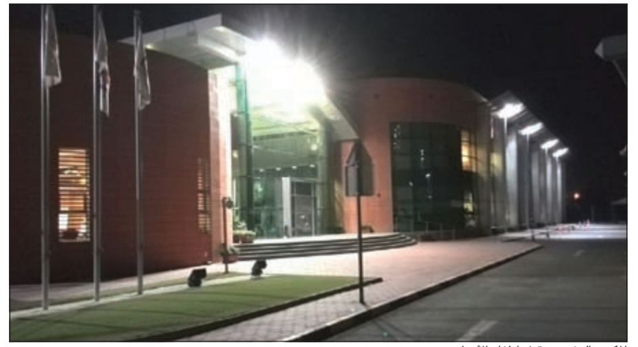
المكتب الرئيسي قبل إطفاء الأنوار

المجموعة تحتفل بالتزامها بدورها في المحافظة على الكوكب.. الالتزام بالتغيير إلى الأفضل