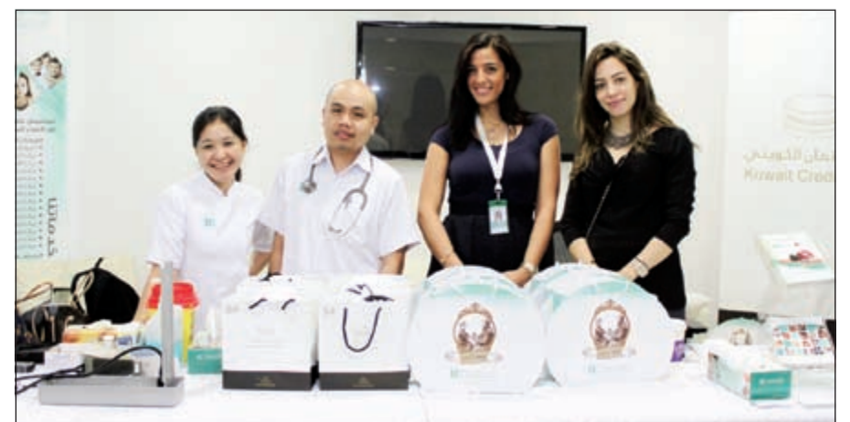
فريق «إنترناشيونال كلينك»

مع استمرار ارتفاع درجة حرارة الأرض، ومستوى الوعي المتزايد تجاه الحفاظ على البيئة، والتزاماً من فندق هوليداي إن الكويت بمسؤوليته الاجتماعية تجاه المجتمع والأجيال القادمة وكوكب الأرض في مثل هذا