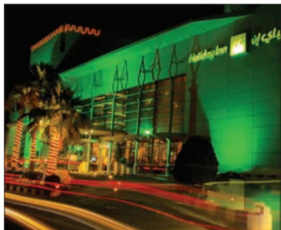
«هوليداي إن الكويت» يشارك بمبادرة ساعة الأرض