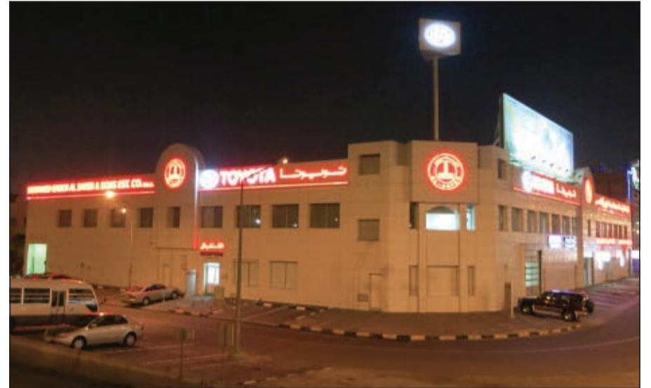
معرض الغزالي أثناء المشاركة في ساعة الأرض