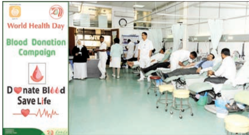
جانب من تبرع موظفي «لو أند لو هايبر ماركت» بالدم

من فريق العمل إلى فحص صحي مبدئي للتحقق من خلوه من الأمراض والحالات التي من الممكن أن تقصيه من الحملة. وقد تم تنظيم حملة التبرع بالدم تحت إشراف ممرضات وأطباء.