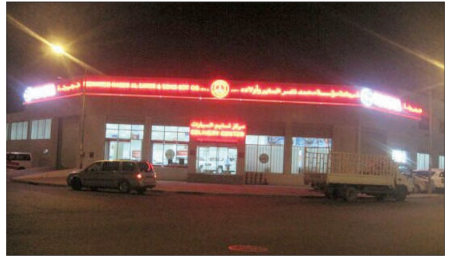
صالة التسليم قبل إطفاء الأنوار

إيماننا من مجموعة السائر بحق الأجيال القادمة بأن يرثوا بيئة صحية ونظيفة من خلال الحفاظ على البيئة والحد من التلوث الذي سببنا مبدأ راسخاً وجزءاً لا يتجزأ من سياستها في التنمية المستدامة ومسؤوليتها الاجتماعية.