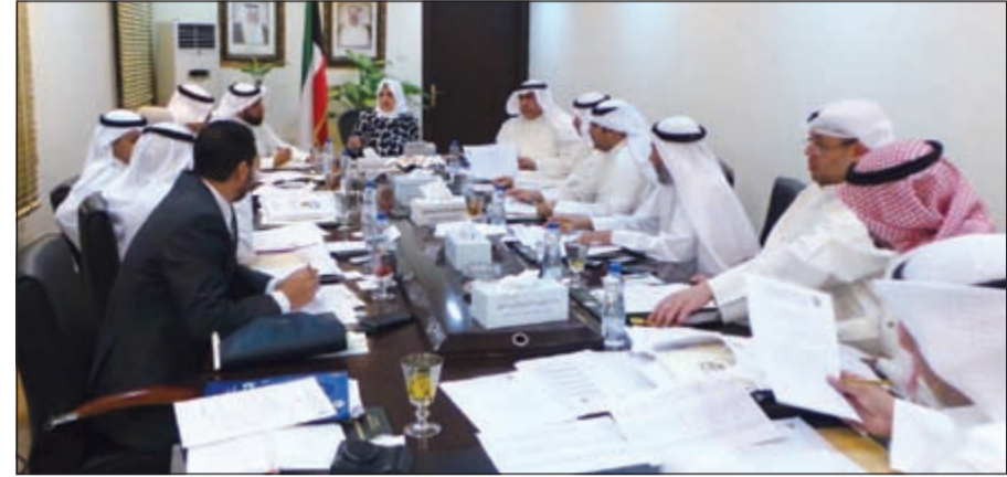
الوزيرة هند الصباح خلال لقائها باللجنة التحضيرية للمؤتمر