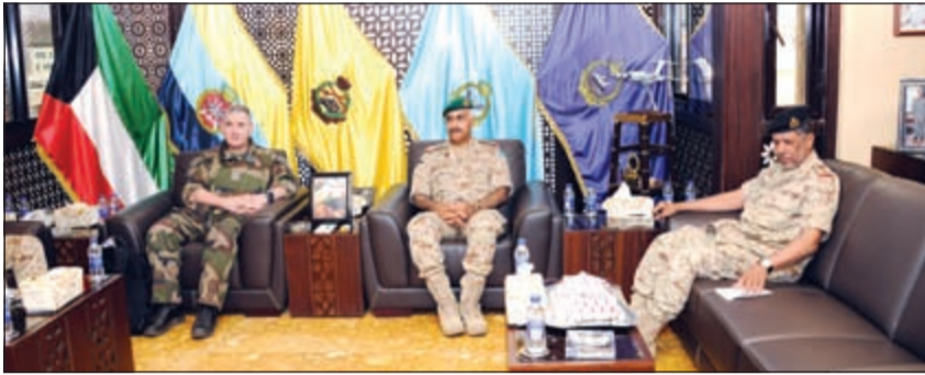
الفريق الركن محمد الخضر مستقبلا الجنرال باتريك بريوس والوفد المرافق

استقبل رئيس الأركان العامة للجيش الفريق الركن محمد الخضر صباح امس، رئيس مركز تخطيط وقيادة العمليات للجيش الفرنسي الجنرال باتريك بريوس والوفد المرافق له بمناسبة زيارته للبلاد. حيث تم خلال اللقاء تبادل الأحاديث الودية ومناقشة أهم الأمور والمواضيع ذات الاهتمام المشترك لاسيما المتعلقة بالجوانب العسكرية وسبل تطويرها وتعزيزها بين البلدين الصديقين.