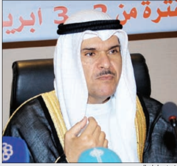
الشيخ سلمان الحمود

الحمود الصباح. الذي يتابع كل التفاصيل الخاصة بمسيرة ونشاطات المؤسسة