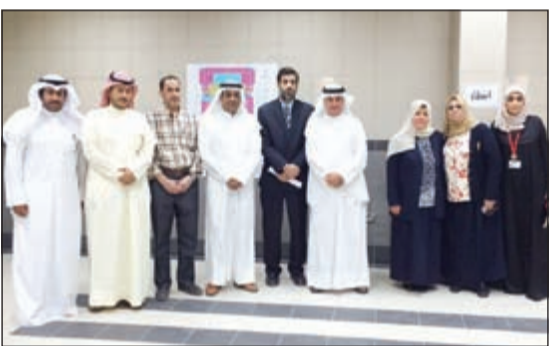
لقطة جماعية عقب عملية الافتتاح