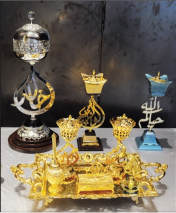
من المشغولات اليدوية بالمعرض

عبدالههاب المطوع التجارية وشركة مركز سلطان وشركة مياه أبراج والدعم السنوي لمبرة خير الكويت. وتقدمت «هلا إكسبو» بجزييل الشكر الى الشبيخة الزين الصباح على رعايتها الكريمة للحدث، وأيضا للعاملين بشركة «مباني العقارية» و«الأقنيزون» لدعمهم لمعرض «هلا إكسبو» وحرصهم على نجاحنا من خلال التنسيق المتواصل لهذه الإنطلاقة، كما أبدع المنظمون في تفعيل المشاركة من خلال وسائل التواصل الاجتماعي عبر حساب السناب جات والإنستغرام «HalaExpo@» الذي تواصل به عدد كبير من الزوار والمتابعين، ومن المتوقع عرض صور مباشرة على الحساب حول الحضور والمشاركين، وبث أخبار المعرض على الهواء.