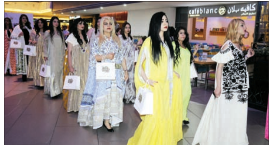
جانبا من عرض الأزياء المصاحب