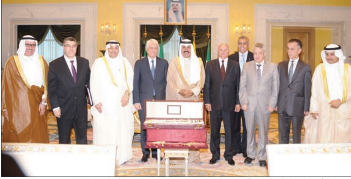
سمو نائب الأمير وولي العهد الشيخ نواف الأحمد مستقبلاً يعقوب الصانع ووزير العدل الجزائري الطيب لوح والوفد المرافق

مهام عمله سفيرا لبلاد.. حضرة المقابلة وكيل ديوان سمو ولي العهد لشؤون المراسم والتشريفات الشيخ مبارك صباح السالم. واستقبل سموه بقصر السيف صباح أمس الشيخ د.إبراهيم الدعيج.