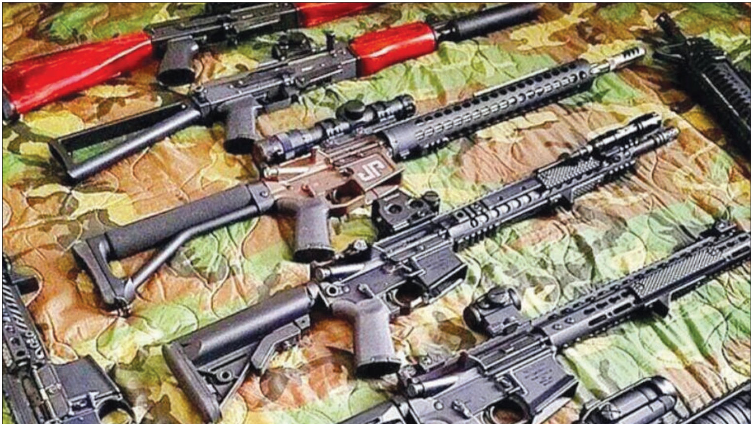
بعض الاسلحة التي القتها طائرات تحالف دعم الشرعية للمقاومة اليمنية في عدن

وفي السياق أكد شهود عيان أن مجاميع مسلحة وقوة موالية للحوثيين وصالح تقدمت أمس الأول على طول خط الطريق البحري بخور مكسر صوب المنصورة بعد عجزها عن اقتحام المعلا وكريت شرق مدينة عدن. وأضاف الشهود لـ «الأنباء»: إن قوة عسكرية راجلة تقدمت صوب جسر الطريق البحري الرابط بين مديرية المنصورة بشمال شرق عدن وبين مديريات خور مكسر والتواهي والمعلا