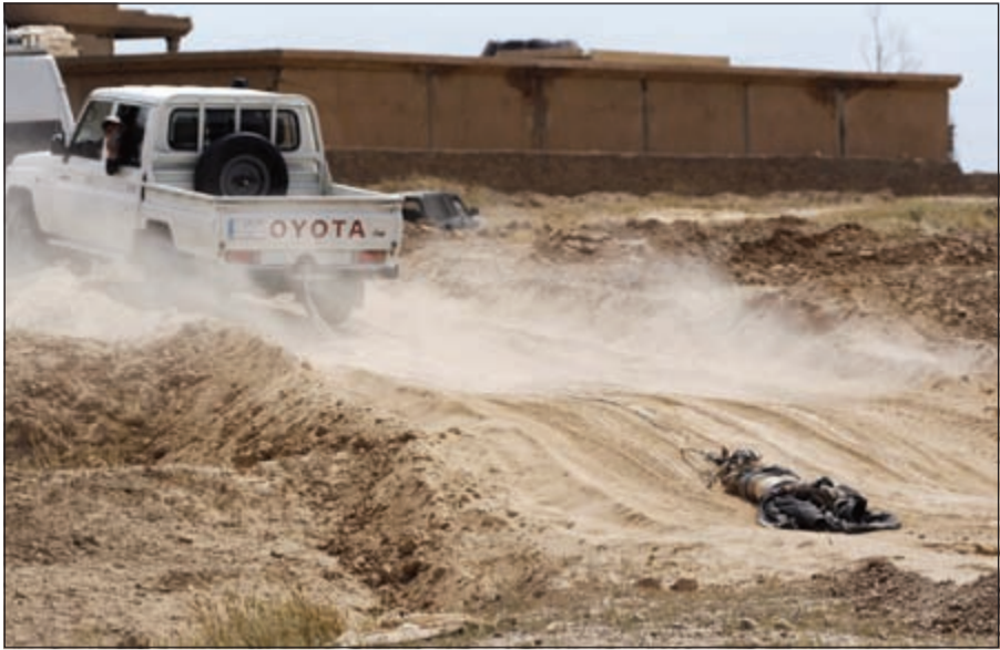
سيارة تابعة للحشد الشعبي تجر جثة أحد مقاتلي «داعش» في تكريت

«داعش»، وبعمليات نهب وسلب وحرق للبيوت في المدينة. وكان مجلس عشائر وجهاء تكريت، طالب في بيان أصدره في وقت سابق أمس، بسحب الحشد الشعبي من تكريت بشكل فوري وتسليم مسؤولية حفظ الأمن للشرطة الاتحادية والمحلية، ومحاسبة الأطراف المسؤولة عن تدمير المدينة.