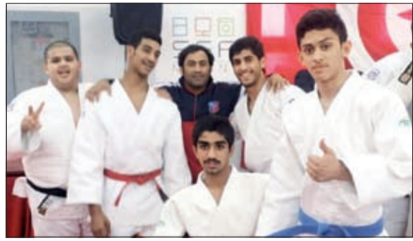
فريق الكويت الحائز على الميدالية الفضية