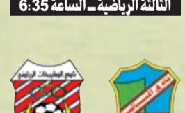
الثالثة الرياضية - الساعة 6:35