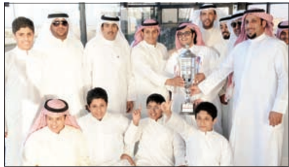
عميد اسطبل ابو شوري يتسلم كأس الشوط الرابع