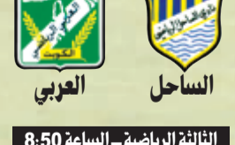
الثالثة الرياضية - الساعة 8:50