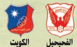
الثالثة الرياضية - الساعة 6:35

وعلى الجهة الأخرى يسعى الفحيحيل لمواصلة عروضة الجيدة مؤخرا حيث يخوض الفريق المباراة قادما من فوز كبير على التضامن 5-1 ففز من خلاله من مؤخرة، الرتيب إلى المركز الـ12، ويضم الفريق مجموعة