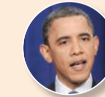
أوباما يشيد ويحذر إيران

قالت وزيرة خارجية الاتحاد الأوروبي فديريكا موغيريني ان «الاتحاد الأوروبي سيوقف العمل بكل العقوبات المالية والاقتصادية المتصلة بالبرنامج النووي». وأضافت ان الولايات المتحدة كذلك «ستوقف تطبيق كل العقوبات المالية والاقتصادية المتصلة بالبرنامج النووي بالتزامن مع تحقق الوكالة الدولية للطاقة الذرية من تطبيق إيران للالتزامات الرئيسية في مجال النووي».