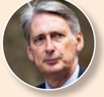
لندن: يفوق التوقعات

أعلن الأمين العام للأمم المتحدة بان كي مون انه «الاتفاق حول النووي الإيراني سيكون له تأثير إيجابي على الوضع الأمني العام والسلام في الشرق الأوسط».