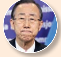
مون: خطوة نحو السلام

كان الرئيس الأميركي أول زعيم يعلق بعد دقائق على اعلان التوصل الى اتفاق في لوزان «أنا على ثقة بأنه وإذا أدى هذا الاتفاق الى اتفاق شامل ونهائي فإن بلادنا وحلفاءها والعالم سيكونون في أمان أكبر». وأضاف ان «إيران ستخضع للتفتيش أكثر من أي دولة أخرى في العالم»، لكنه حذر بأنه «إذا تحالفت إيران، فسيعلم العالم، وإذا لاحظنا أي أمر مريب فسنقوم بعمليات تفتيش».