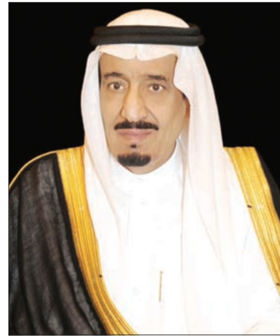
خادم الحرمين الشريفين الملك سلمان بن عبدالعزيز

الرياض - واس - وكالات: أعرب خادم الحرمين الشريفين الملك سلمان بن عبدالعزيز عن أمله في أن يتم الوصول إلى «اتفاق نهائي ملزم» بشأن نووي إيران، يؤدي إلى تعزيز الأمن والاستقرار في المنطقة والعالم. وقالت وكالة الأنباء السعودية الرسمية (واس). وقال الملك سلمان بن عبدالعزيز في اتصال هاتفي مع الرئيس الأميركي باراك أوباما، وحسب وكالة الأنباء السعودية الرسمية (واس). وقال الملك سلمان بن عبدالعزيز في اتصال هاتفي مع الرئيس الأميركي، عبر فيه «عن التوصل مع إيران إلى اتفاق إطاري بشأن ملفها النووي». وأبدى أوباما في الاتصال حرص الولايات المتحدة الأميركية على السلام