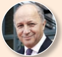
فرنسا تلزم الحذر

أعلنت وزيرة الخارجية الروسية في بيان ان هذا الاتفاق «يستند الى المبدأ الذي عبر عنه الرئيس الروسي فلاديمير بوتن، وهو حق إيران غير المشروط في برنامج نووي مدني». وتابعت انه «ليس هناك أدنى شك ان الاتفاق حول النووي الإيراني سيكون له تأثير إيجابي على الوضع الأمني العام في الشرق الأوسط، إذ ستكون إيران قادرة على المشاركة في شكل أكثر فاعلية في حل عدد من المشاكل والنزاعات في المنطقة».