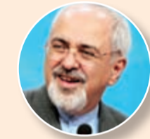
إيران: خطوة إلى الأمام

أعلن رئيس الوزراء الإسرائيلي بنيامين نتنياهو متوجهاً الى أوباما ان الاتفاق الإطار في حال تطبيقه سيهدد بقاء إسرائيل، حسبما نقل عنه المتحدث باسمه.