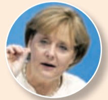
ميركل: قريبون من الاتفاق

أعلنت وزيرة الخارجية الروسية في بيان ان هذا الاتفاق «يستند الى المبدأ الذي عبر عنه الرئيس الروسي فلاديمير بوتن، وهو حق إيران غير المشروط في برنامج نووي مدني». وتابعت انه «ليس هناك أدنى شك ان الاتفاق حول النووي الإيراني سيكون له تأثير إيجابي على الوضع الأمني العام في الشرق الأوسط، إذ ستكون إيران قادرة على المشاركة في شكل أكثر فاعلية في حل عدد من المشاكل والنزاعات في المنطقة».