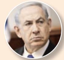
بقاء إسرائيل مهدد

أعلن وزير الخارجية الفرنسي لوران فابيوس انه «تقدم إيجابي لا يمكن إنكاره لكن لا يزال هناك عمل لابد من إنجازه».