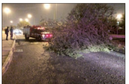
الشجرة وقد أغلقت أحد طرق السالمية