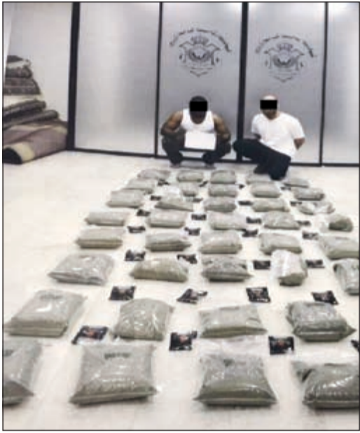
المتهمان في قضية الـ «الكيميكال»، قبل الإحالة إلى النيابة