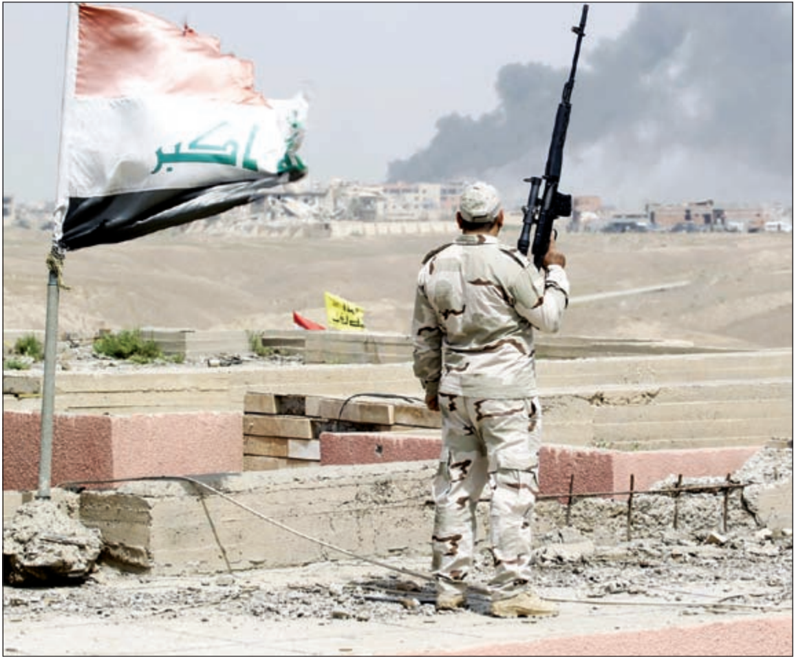
فرد أمن عراقي يحمل سلاحه وهو يشاهد الدخان يتصاعد من مسرح الاشتباكات بين الجيش العراقي ومسلحي داعش في تكريت

عواصم - وكالات: أعلنت مصادر أمنية وأخرى محلية عراقية أمس استعادة المقار الحكومية في مدينة تكريت شمال بغداد في إطار العمليات التي تنفذ منذ بداية الشهر الجاري لاستعادة السيطرة عليها من مسلحي تنظيم الدولة الإسلامية المعروف إعلامياً باسم «داعش».