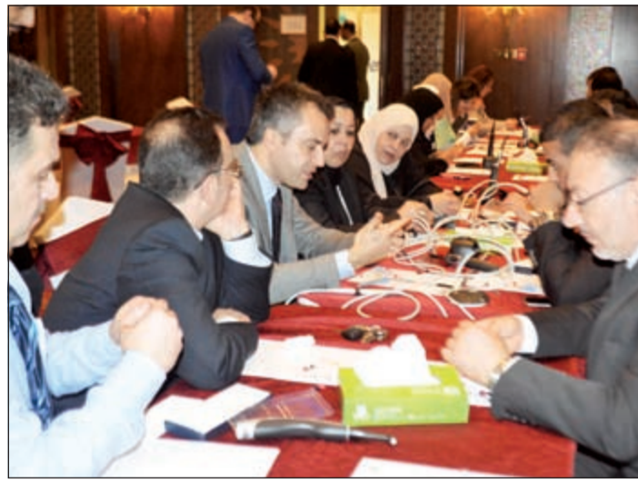
جانب من الحضور والمشاركين