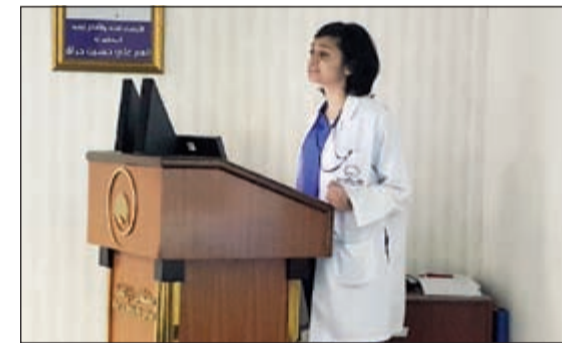
جانب من المحاضرة

المساهمة في تعزيز نشاطنا ونمط الحياة الصحية مع بعض التمارين السليمة التي يمكننا ممارستها يوميا بسهولة.