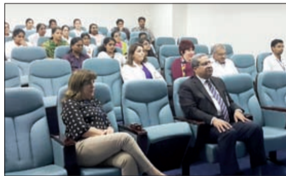
متابعة من الحضور