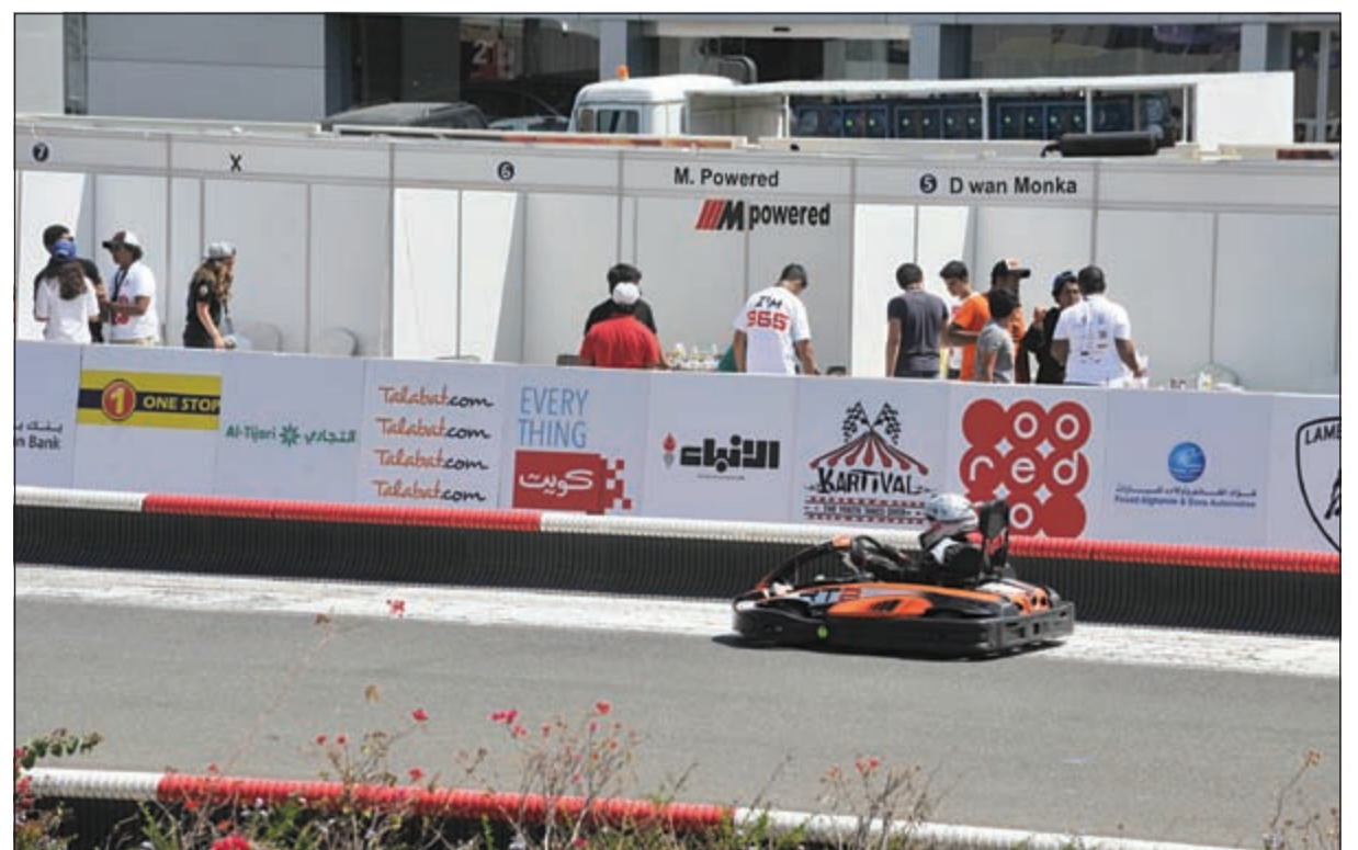
«الأنباء» حاضرة كراع إعلامي للحدث