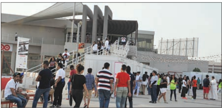
إقبال شبابي ومتابعة للحدث