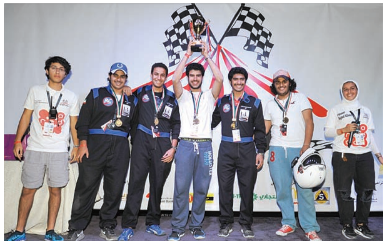
فريق «ادريالين رش» صاحب المركز الثالث