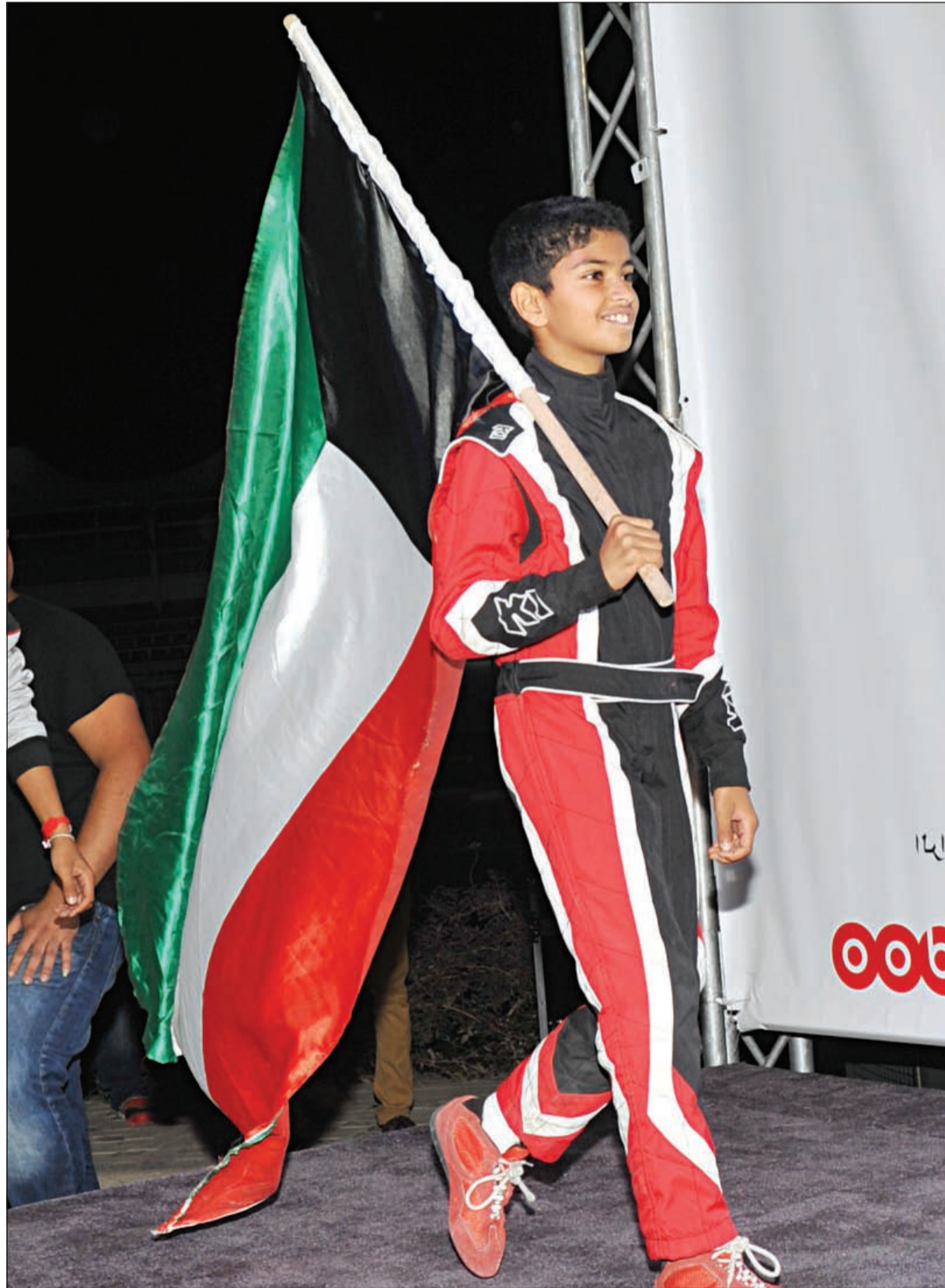
السائق البطل الخالد حاملا العلم