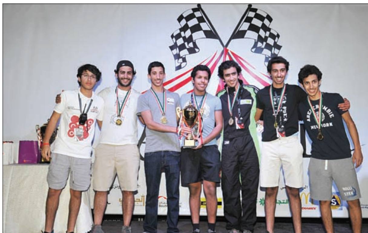
فريق «سبواي ريسينغ» صاحب المركز الثاني