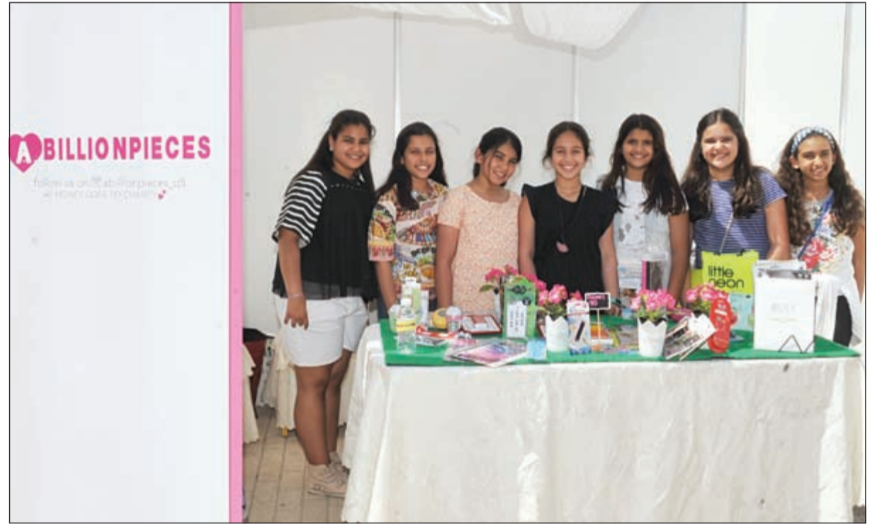
عروض من مواهب كويتية شبابية