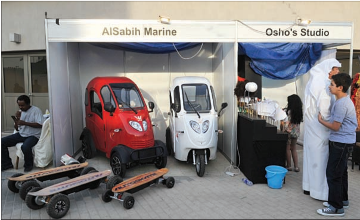
أحدث السيارات في المهرجان