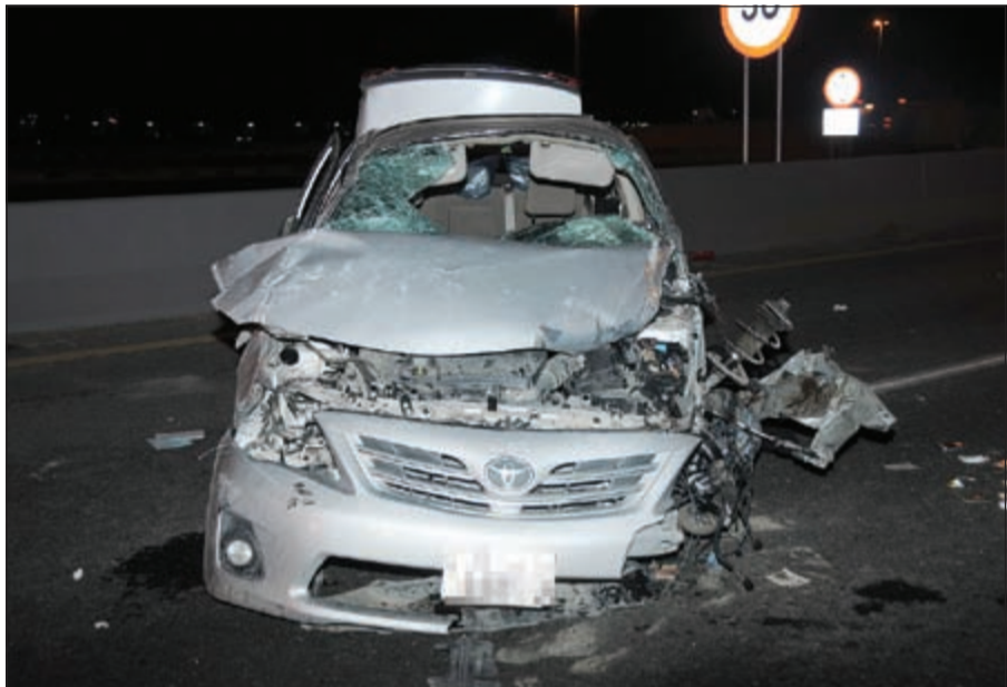
المركبة وقد تهمت من جراء الحادث