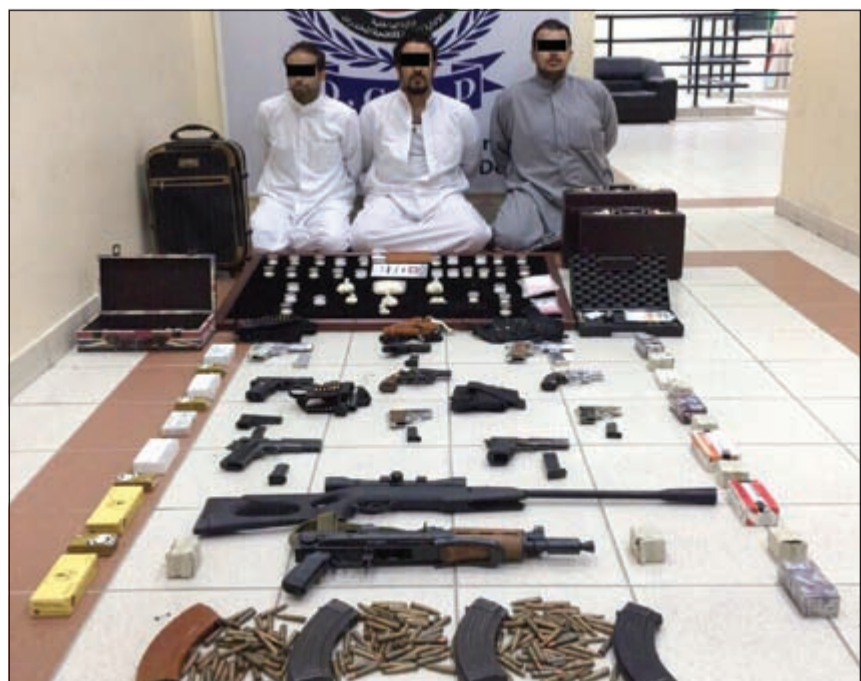
التهمون وأمامهم الأسلحة والمخدرات المضبوطة

تمكن رجال وزارة الداخلية من ضبط 3 مواطنين بحوزتهم 4000 حبة كبتاغون و3 قطع حشيش وعدد 14 سلاحا ناريا وكمية كبيرة من الذخيرة.