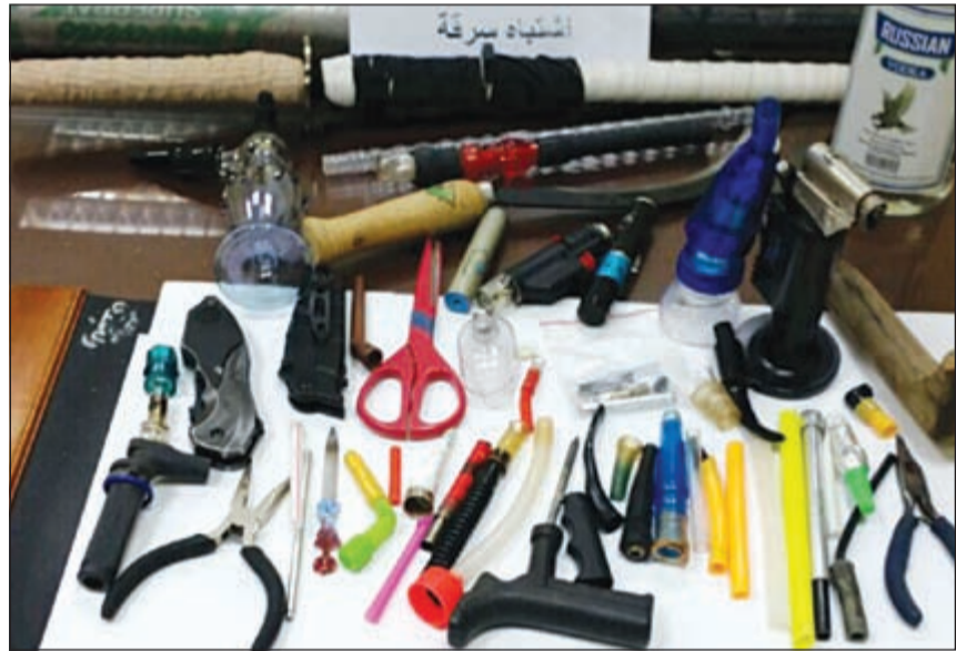
المضبوطات التي كشفت عنها المخالفة

أكدت وزارة الداخلية أن استصدار رخص السوق للمندوبين والسائقين مرهون بإذن الشؤون وقال كتاب صادر عن إدارة الإعلام الأمني: إن قطاع المرور يستثنى هاتين الوظيفتين من شرط الراتب والمؤهل الجامعي وجاء في كتاب الداخلية: تهديك إدارة الإعلام الأمني بوزارة الداخلية أطيب التحية، وتقدر دوركم الإعلامي البناء في خدمة القضايا الأمنية والتعاون مع وزارة الداخلية. وبالإشارة إلى ما ورد في صحيفتكم الموقرة العدد رقم 14019 الصادر بتاريخ 2015 /3 /2 تحت عنوان (سوالف أمنية).