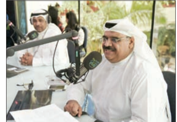
الفنان الكبير داود حسين خلال سحب الدانة

بالإضافة إلى جائزتين كل ربع سنة. أما السحب ربع السنوي الثالث فسيقام في 17 سبتمبر على الجوائز التالية: (500 ألف دينار، 125 ألف دينار و25 ألف دينار) أما السحب الرابع والأخير فسيجري في 7 يناير 2016 على الجوائز النقدية بقيمة 50 ألف دينار و250 ألف دينار كما سيختل هذا السحب بتوزيع مليونير الدانة لعام 2015 الذي سيحصل على جائزة بقيمة مليون دينار.