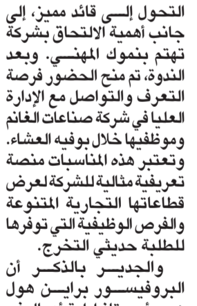
البروفيسور براين جي هول متحدثاً خلال الندوة

أقيمت لأجلها بالنسبة لجميع المشاركين، وركزت الندوة، التي ترأسها أستاذ كلية إدارة الأعمال في جامعة هارفارد، البروفيسور براين جي هول، على «مهارات التفاوض الناجح في قطاع الأعمال» من خلال