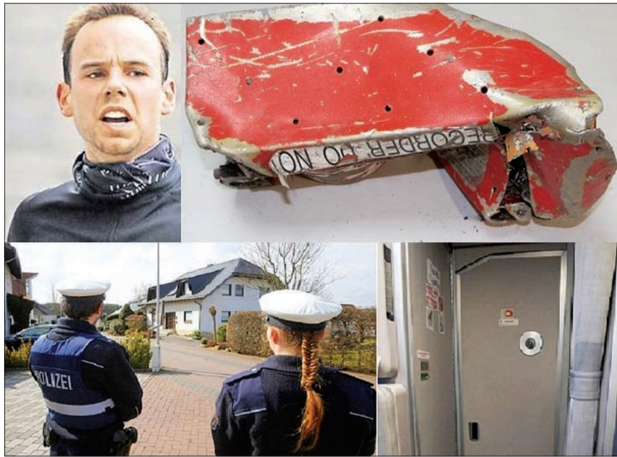
مجموعة صور تبين الصندوق الأسود ولويتز محطم الطائرة ثم باب قمرة القيادة والرائعة لبيت والدي لويتز