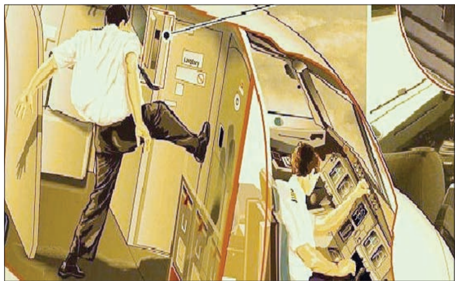
صورة تعبيرية للطيار وهو يحاول جاهدا فتح باب الكابينة

عواصم - وكالات: خاض قائد الطائرة الألمانية في آخر 10 دقائق سبقت ارتطامها صباح الثلاثاء الماضي بإحدى قمم الجبال الفرنسية من جبال الألب، معركة حقيقية ومستتمة لينقذها مع 150 كانوا على متنها، من برائن مساعده الذي كان منشغلا بإسقاطها، فلم يفلح، إلا أن أصوات المعركة محفوظة في الصندوق الأسود الذي انتشلوه من الحطام الجمعة الخير العالمي الأبرز مع الحملة الهادفة في اليمن لإعادة الشرعية.