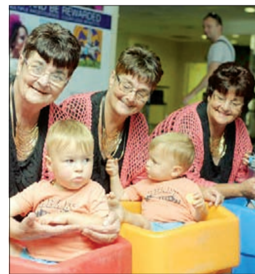
أكثر 3 توائم في المهرجان

سيدني - وكالات: شارك آلاف من التوائم، في فعاليات مهرجان التوائم، الذي عقد في مدينة ملبورن بأستراليا، في احتفالية كبيرة، ولم تتوقف فقط على توائم واحد بل ثلاثة، وأربعة أيضاً. المهرجان كان متاحاً للجميع، ولجميع الأعمار، ليلتقوا التوائم ويتعرفوا على بعضهم البعض، ويقوموا بالغناء والاستمتاع بالموسيقى، وحتى التسوق وكأنه موسم شراء.