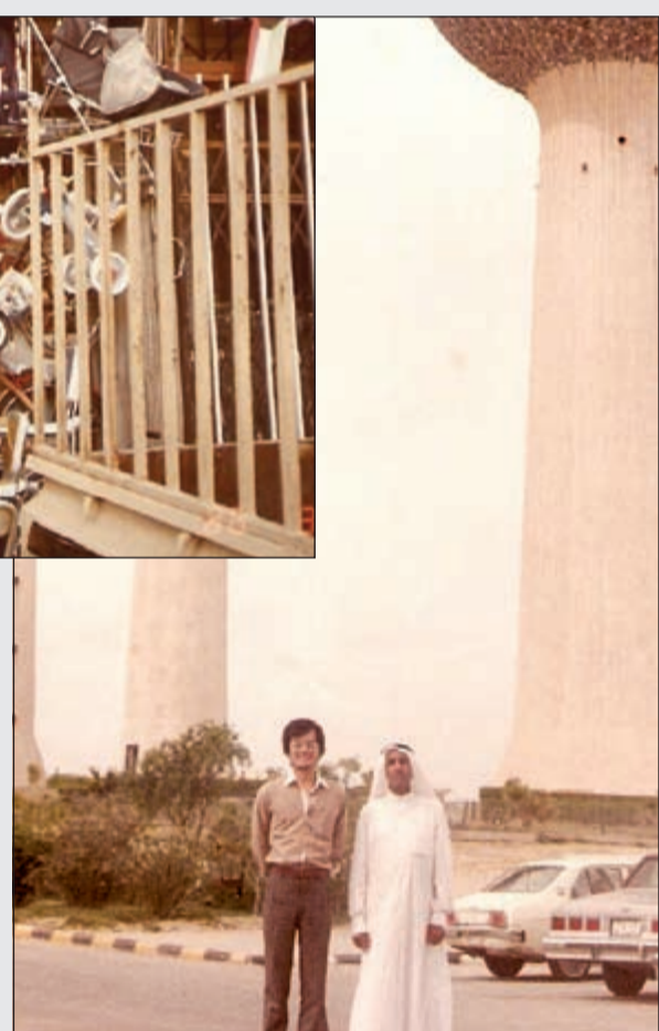
العديلة مع أحد ضيوفه من اليابان أمام أبراج الكويت

الوالد في الفنتاس كان يعمل بالبحر في صيد السمك والغوص على اللؤلؤ وبعدما سكن مدينة الكويت فتح محلاً لبيع «الجت» في السوق