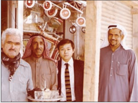
العديلة مع أحد الضيوف من خارج الكويت

في أيام الأعياد كنت أخذ جميع الدراجات وأذهب بها خلف سور الكويت حيث يستأجر الشباب ويلعبون بعيداً عن الازدحام والناس