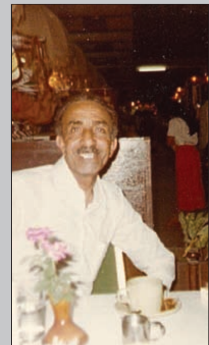
العديلة في أحد المقاهي خارج الكويت