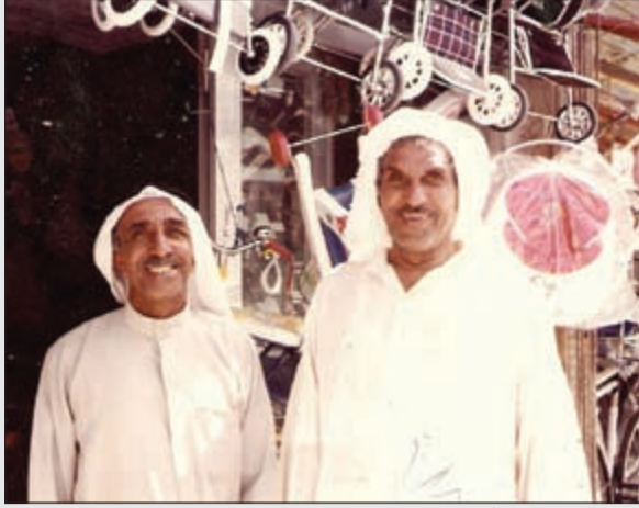
العديلة مع صديق أمام محله