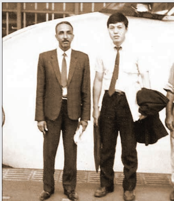
العديلة في إحدى زياراته إلى اليابان