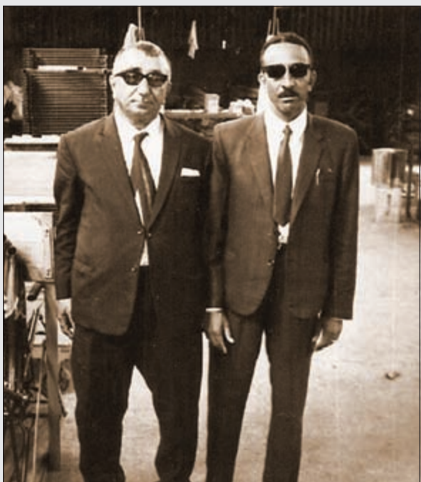
العديلة مع أحد الأصدقاء