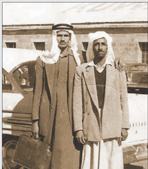
العديلة في موقف سيارات التاكسي في الخمسينيات

هناك روايتان لسبب تسمية العائلة «العديلة» إحداهما بسبب الجودة والثانية تعود لسلوكيات الوالدة