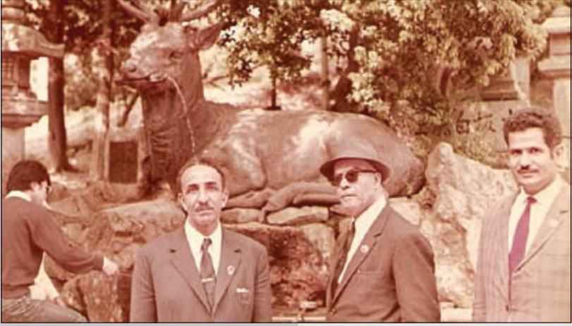
العديلة مع أحد أصدقائه في حديقة باليابان