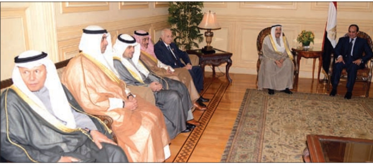
الرئيس المصري عبدالفتاح السيسي مستقبلاً صاحب السمو الأمير والوفد المرافق لسموه

شم الشيخ - «كونا»: بحفظ الله ورايعة وصل صاحب السمو الأمير الشيخ صباح الأحمد والوفد الرسمي المرافق لسموه مساء أمس إلى مطار شرم الشيخ الدولي، وذلك لترؤس وفد الكويت في مؤتمر القمة العربية السادسة والعشرين لجامعة الدول العربية والمزمع عقده في مدينة شرم الشيخ. وكان في استقبال الرئيس عبد الفتاح السيسي رئيس جمهورية مصر العربية والشيخ شرم الشيخ. وكان في وداع سموه على أرض المطار سمو نائب الأمير ولي العربية الشقيقة سالم غصاب الزمانان ومدبونا الدائم لدى جامعة الدول العربية عزيز الديحاني وأعضاء السفارة والمندوبية. وكان صاحب السمو الأمير الشيخ صباح الأحمد والوفد الرسمي المرافق لسموه غادر أرض الوطن عصر أمس متوجها إلى جمهورية مصر العربية الشقيقة وذلك لترؤس وفد الكويت في مؤتمر القمة العربية السادسة والعشرين لجامعة الدول العربية والمزمع عقده في مدينة شرم الشيخ. وكان في وداع سموه على أرض المطار سمو نائب الأمير ولي وزير التجارة والصناعة بالوكالة انس الصالح، واحمد فهد الفهد، مدير مكتب صاحب السمو الأمير، والمستشار بالديوان الأميري محمد ابوالحسن، ورئيس المراسم والتشريفات الأميرية الشيخ خالد العبدالله، ووكيل وزارة الخارجية خالد الجارالله، ورئيس الشؤون الإعلامية والثقافية بالديوان الأميري يوسف الرومي، والوكيل للشؤون السياسية والاقتصادية بالديوان الأميري الشيخ فواز سعود ناصر، ووكيل وزارة الخارجية، ووزير المالية.