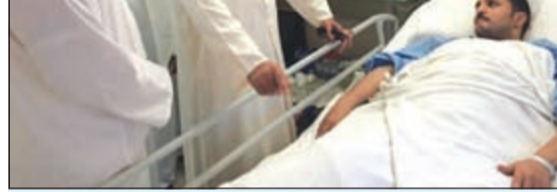
الشيخ محمد الخالد خلال زيارته أحد المصابين