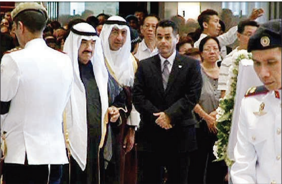
ممثل صاحب السمو الأمير الشيخ صباح الأحمد سمو الشيخ ناصر الحمد خلال مشاركته في مراسم التشييع

غادر ممثل صاحب السمو الأمير الشيخ صباح الأحمد سمو الشيخ ناصر الحمد جمهورية سنغافورة الصديقة وذلك بعد أن مثل سموه في مراسم تشييع رئيس وزراء سنغافورة السابق لي كوان وكان في وداعه ممثل سموه مدير إدارة شؤون الشرق الأوسط في وزارة الخارجية السنغافورية وسفيرنا لدى جمهورية سنغافورة الصديقة يعقوب السند. وكان ممثل صاحب السمو الأمير الشيخ صباح الأحمد، سمو الشيخ ناصر الحمد قد شارك في مراسم تشييع رئيس وزراء سنغافورة السابق لي كوان يون.