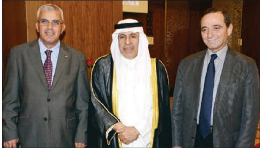
سفراء الأردن والسعودية وفلسطين