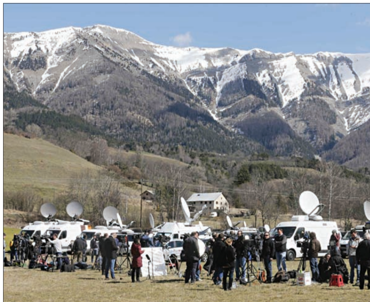
وسائل اعلام عالمية بالقرب من مكان سقوط الطائرة

عندما بدأت الطائرة «بالانحدار المتسارع» وان هذا لا يحدث إلا بشكل متعمد، مؤكداً أن مساعد الطيار كان حيا حتى وقوع الاصطدام، مشيراً إلى سماع صوت انفاسه في قمرة القيادة.