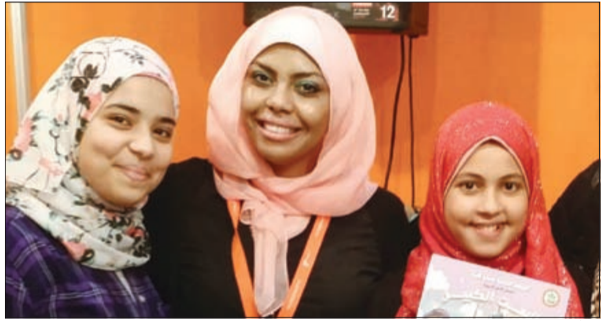
مع أطفال معرض الكتاب في الشارقة