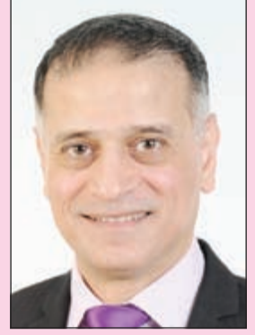
إعداد: د. طارق البكري

أصبحت أترقب يوم الجمعة من كل أسبوع لكي ألتقي بكم، ولا تدرون مقدار سعادتي بلقائكم أيها الأحبة، فأنا أفرح كثيرا عندما أعلم أنكم تحبون القصص والمعلومات والألعاب واللغات التي نعرضها في الموضوعات المخصصة للأطفال، وهذا دليل كبير على رغبتكم الدائمة في القراءة ويشجعني أكثر على الكتابة لكم.