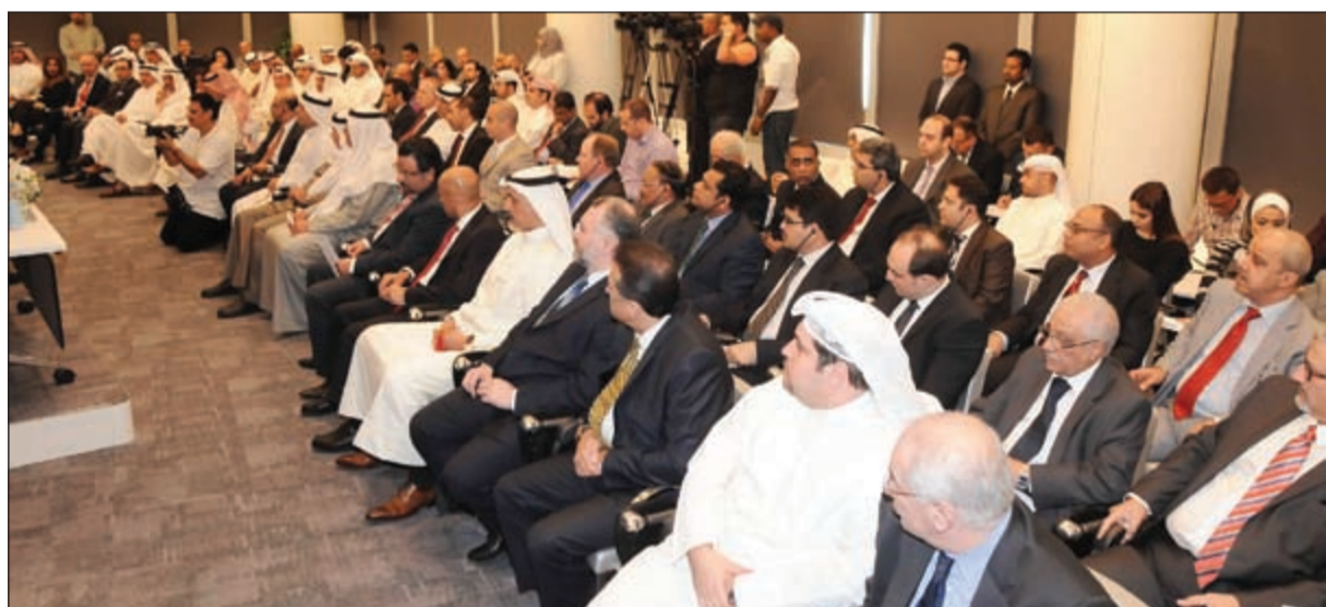
حضور كبير خلال عمومية «كيكو»

استحواذ إسلامي وبشأن توجهه إلى الاستحواذ على بنك إسلامي من قبل المجموعة قال العيار إن بنك برقان ما زال لديه المزيد من الوقت لتحقيق أفضل معدلات للنمو وهو أمر