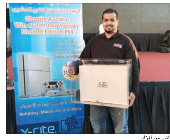
جانب من المزاد