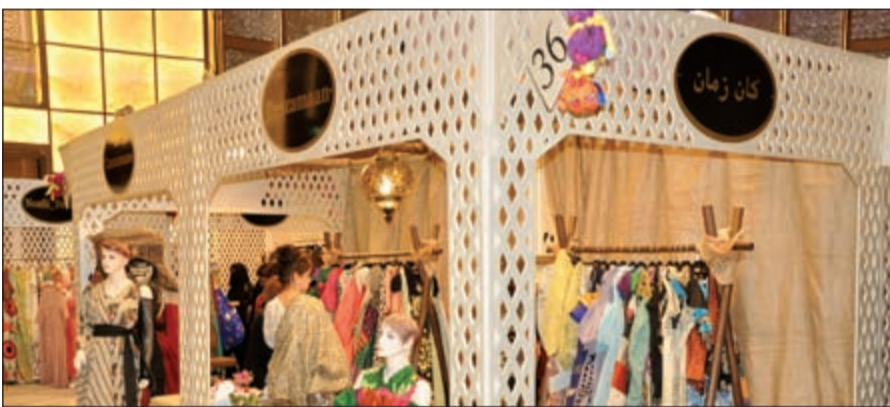
أحد الأجنحة المشاركة في المعرض