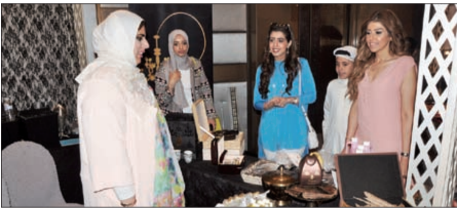
الشيخة فرح الصباح خلال جولة في المعرض (أحمد علي)