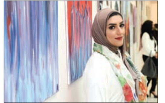
إحدى المشاركات في المعرض