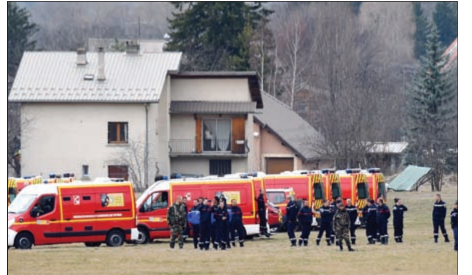
فرق الانقاذ تجمعت بعد الإعلان عن الحادث