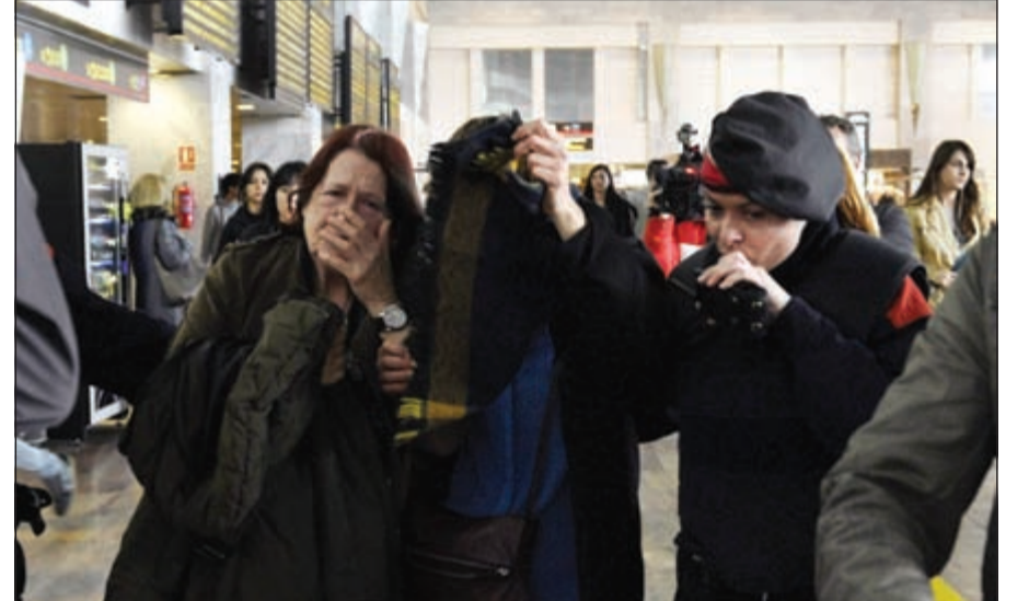
بكاء وعويل من أهالي الضحايا

جيرمان وينغز، وإضاف «لا نعرف حتى الآن ما حصل مع الرحلة 4 يو 9525، معياراً عن تضامنه مع عائلات الضحايا واصداقائهم»، وقال «أنا تحققت اسوا مخاوفنا فانه يوم اسود لشركة لوفتهانزا». وتامل في العثور على ناجين». من جهته، قال وزير الخارجية الألماني فرانك فالتر شتاينماير «انه ننا رهيب»، وكتب على تويتر «نتضامن مع الذين لهم اصدقاء في صفوف الضحايا».