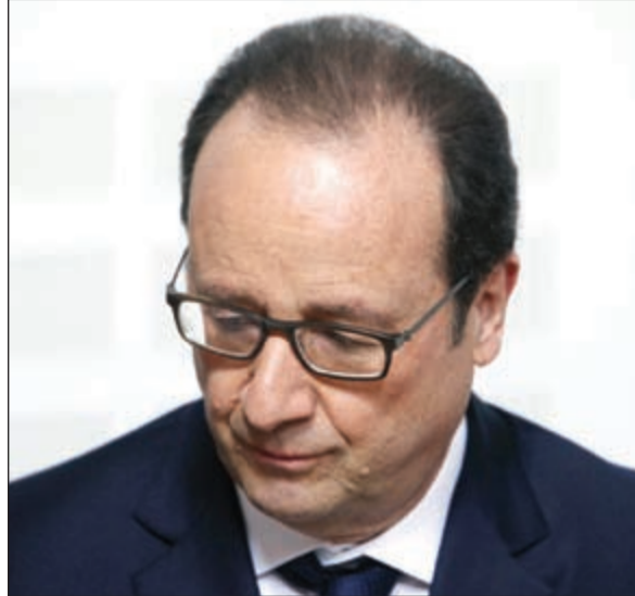
الحزن مرسوم على وجه الرئيس الفرنسي

كونا: بعث صاحب السمو الأمير الشيخ صباح الأحمد ببرقيات تعازٍ إلى كل من الرئيس يواخيم غاوك - رئيس جمهورية ألمانيا الاتحادية والملك فليبي السادس ملك مملكة إسبانيا والرئيس فرانسوا هولاند رئيس الجمهورية الفرنسية عبر فيها سموه عن خالص تعازيه وصادق مواساته بضحايا حادث تحطم طائرة الركاب الألمانية من مواطني ألمانيا وإسبانيا وفرنسا فوق جبال الألب جنوب فرنسا، راجيا سموه للضحايا الرحمة ولذويهم جميل الصبر وحسن العزاء.