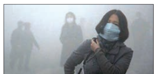
التلوث في الصين

بكين - أ.ش.أ: أعربت السلطات الصينية عن الزعجاء من نجاح الفيلم الوثائقي «تحت القبة» والذي يتناول في 130 دقيقة تحقيرا حول تلوث المدن الكبرى في الصين، والذي عرض على موقع فيديو «يوكو» الصيني، تمت مشاهدته أكثر من 155 مليون مرة خلال عدة أيام. ويعرض الفيلم تحقيرا لتقصي الحقائق أجرته الصحافية شاي جينج، عن تلوث المدن الصينية الكبرى وهي تظهر وتحلل الغيوم الكثيفة من الجزيئات الكيماوية التي تغطي بطريقة مستمرة 80% من المدن الصينية، وتضرب مثلا بمدينة «زيان» التي يسكنها 8 ملايين مواطن، والذين انتابتهم حالة من السعال الذي منعهم من النوم، كما جعلها تنتقد المؤسسات والمصانع، وقامت بالتعليق بشكل عدائي، ما اضطر السلطات الصينية إلى سحب الفيلم من على «يوتيوب» الصيني بالرغم من أن هناك صينيا من بين تسعة شاهدوا الفيلم.