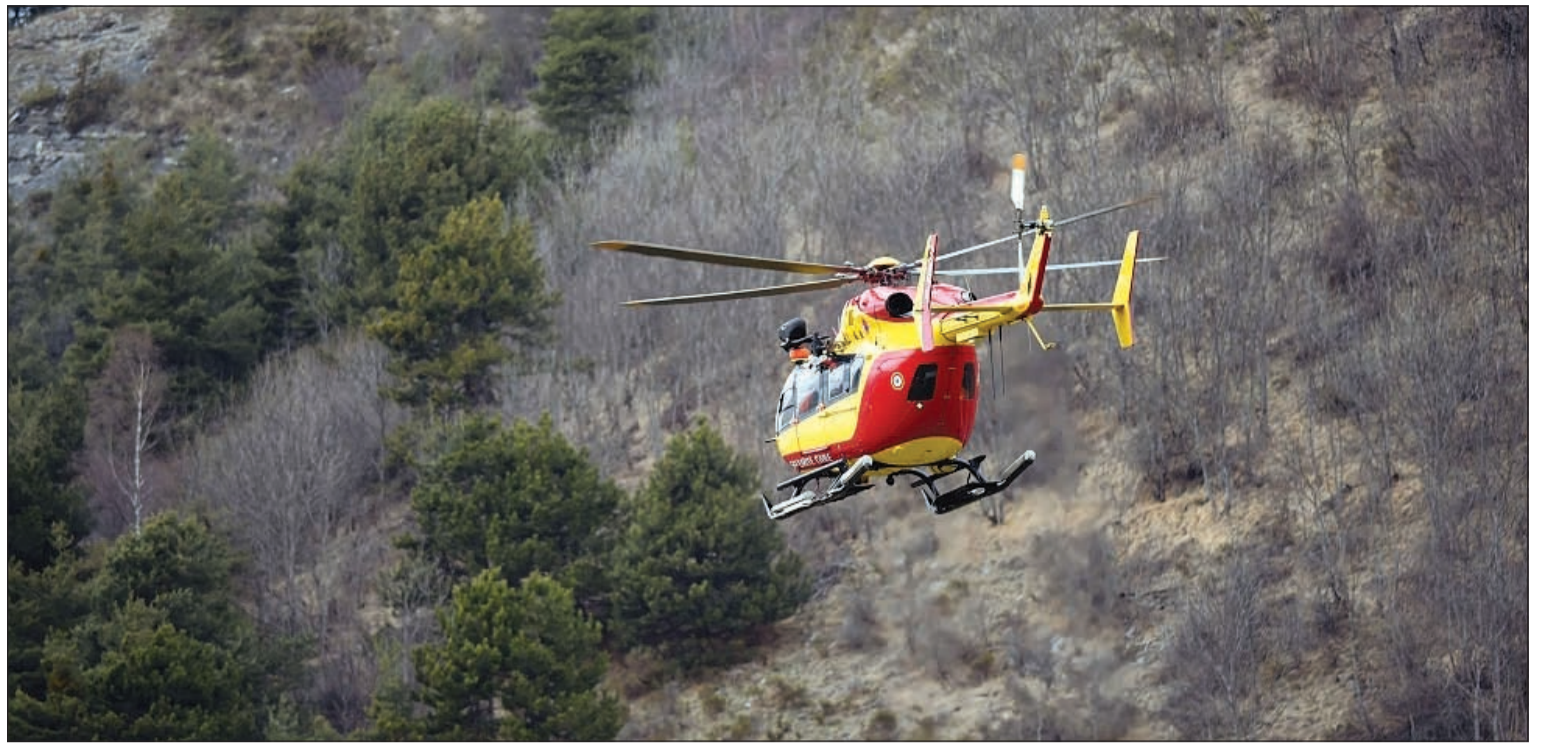
طائرة مروحية تحلق فوق جبال الألب بحثاً عن الطائرة

الرئيس الفرنسي وصف الحادث بالمأساة ورئيس مجموعة لوفتهانزا: يوم أسود في تاريخ الشركة