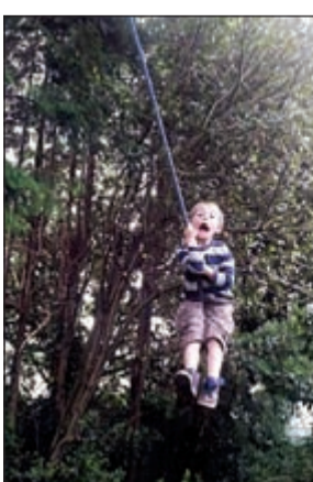
ابن وابنة البريطانية يلعبان أثناء الرحلة

لاي شخص، فكل عائلة لديها أساليبها الخاصة في التعليم، ولكن من الصعب حقا إقناع سلطة التعليم المحلية بذلك، فانا أشعر أن أطفالنا قد يتعلمون مهارة ثمينة جدا عندما يذهبون إلى حديقة للتزلج أو يلعبون مع الحيوانات في الحديقة، بدلا من الشعور بالملل في المدرسة، ولكن عندما قضيت ليلتي الأولى في الزنزانة شعرت بفداحة ما فعلت، فانا في السجن وأطفالي على بعد أميال مني وحيدين وضعفاء».