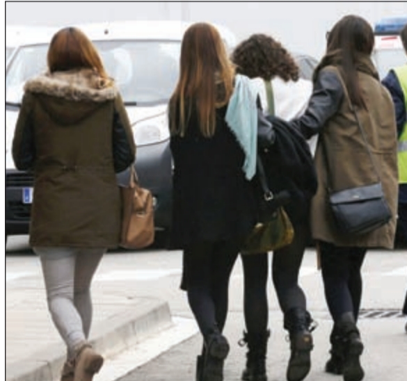
بعض أهالي الضحايا