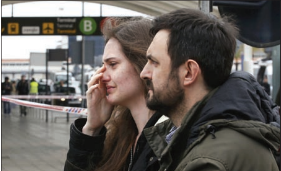
(أ.ف.ب - رويترز - أب)

وأعلن وزير الدولة الفرنسي للنقل الإن فيدالي انه «ليس هناك أي ناج» من