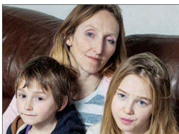
الأم وابنتها وولدها

مقتنعا جدا للألم كلوديا التي تقول «عدلت عن رأيي الآن وأصبحت أتأكد من أنهم يحضرون في المدرسة بنسبة 100% ولا يتغيبون يوما واحدا عن الفصل»، وتضيف في فيديو نشرته صحيفة ديلي ميل البريطانية اعترفت فيه