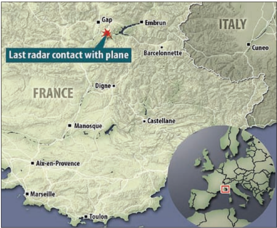
خريطة توضح آخر موقع تم رصد الطائرة فيه عن طريق الرادار