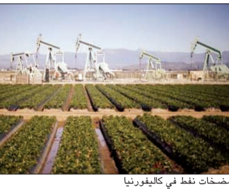
مخاض نفط في كاليفورنيا