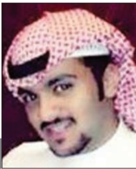
ماجد الفزوري @M_ALG

مليت أجامل فراقك يا ثقل دمك أتعبني البعد أنا وما قلت له توبه عذبني الوقت وأنت تزيدني بهمك مشاعرك باتجاهي حيل منكوبه ضاققت علي الوسيعه وأنت ما همك الشاعر اللي تركته ما حدن صوبه تخيل أنك مكاني ولا حدن ضمك همومك كبار والأوجاع مقلوبه يا تايهه حرفك اللي ذاب في فمك أعجبتني الناس وأنتي أكبر اعجوبه عذالنا تقول ماجد ليه ما ذمك وأنتي تقولين ماجد ياحلو اسلوبه قصيدتي فيك ردها ولد عمك هو مادي ان القصيده فيك مكتوبه