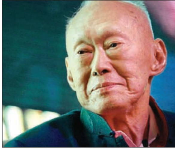
لي كوان يو

كوالامبور - وكالات: نعت سنغافورة أمس الوالد المؤسس لهذه الجمهورية الآسيوية الحديثة، لي كوان يو، عن عمر ناهز الـ 91 عاما اثر تعرضه لالتهاب رئوي حاد منذ فبراير الماضي.