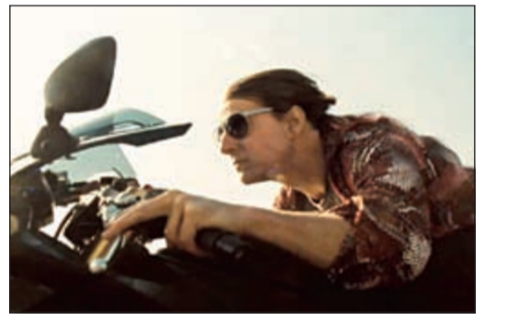
توم كروز في المهمة المستحيلة 5

أتلانتا - سي.إن.إن: عرض النجم الأمريكي، توم كروز، على صفحته بموقع «تويتر» الاجتماعي لقطات لخامس أجزاء سلسلة أفلامه «المهمة المستحيلة»، بعدما قررت الشركة المنتجة تقديم موعد عرضه، ويلعب كروز دور الجاسوس إيثان هنت في فيلم «المهمة المستحيلة دولة مارقة».