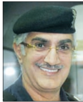
اللواء ابراهيم الطراح

أمن الجهراء اجتمع بالمقدمين غنيم العتل ومطر السبيل بعد ورود معلومة عن التشكيل العصابي الذي يقوم بسرقة السيارات ذات الموديلات القديمة لتكن البداية بتحديد هوية أحد اللصوص حيث تم ضبطه بعد محاولته الفرار من