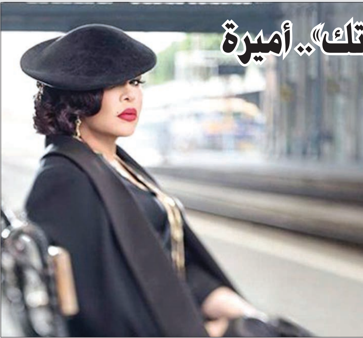
فنانة العرب في الكليب