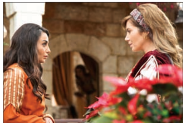
مشهد من مسلسل «بنت الشهبندر»

سرب قبل أسبوعين تقريبا، فيديو يروي حكاية مسلسل «بنت الشهبندر»، بعد أيام قليلة من انتهاء تصويره في لبنان، ما أثار استياء صناعات العمل، وخصوصا منتج العمل