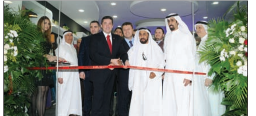
السفير التركي يفتتح معرض الفيمو للأثاث والمفروشات