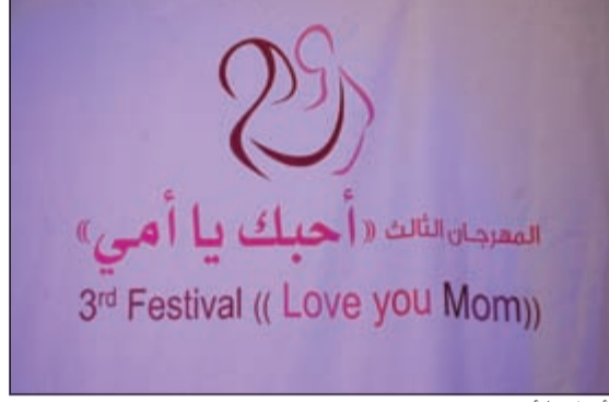
«أحبك يا أمي»