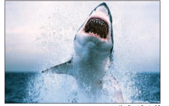
القرش التهم السائح