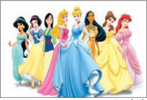
عالم وائل ديزني