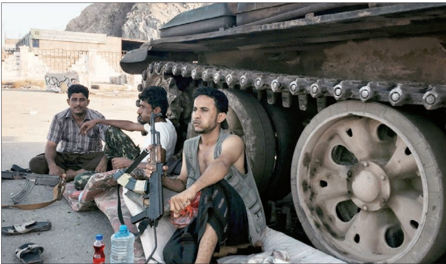
مسلحون من اللجان الشعبية الموالية للرئيس عبد ربه منصور هادي يمضغون «القات» خلال حراستهم لعدد من المواقع في عدن

على المظاهرين، ولليوم الثاني على التوالي انطلق الآلاف من المواطنين في تعز بمسيرة انجهدت إلى مقر قوات الأمن الخاصة، لرفض وجود القوات التابعة للحوثيين هناك، والمطالبة بخروجها. هذا وناشد الرئيس اليمني مجلس الأمن تقديم المساعدة العاجلة لوقف «عدوان» مسلحي الحوثي بقرار بموجب الفصل السابع، الذي يتيح استخدام القوة العسكرية. وأضاف «ما تقوم به الميليشيات الحوثية وحلفاؤها لا تهدد السلم في المنطقة فحسب بل تهدد الأمن والسلم الإقليمي والدولي». وتابع «أطلب من كافة أعضاء مجلس الأمن حماية الشرعية الدستورية والحفاظ على المبادرة الخليجية وألياتها التنفيذية وقرارات مجلس الأمن الداعمة لها». وإزاء تقدم الحوثيين باتجاه عدن، قامت القوات اليمنية الموالية للرئيس عبدربه منصور هادي مع عناصر اللجان الشعبية المؤيدة له بالانتشار حول عدن. وذكر مصدر عسكري لوكالة فرانس برس ان هذه القوات شكلت حزما أمنيا حول المدينة الجنوبية «معزة بجوالي 40 دبابة في شمال