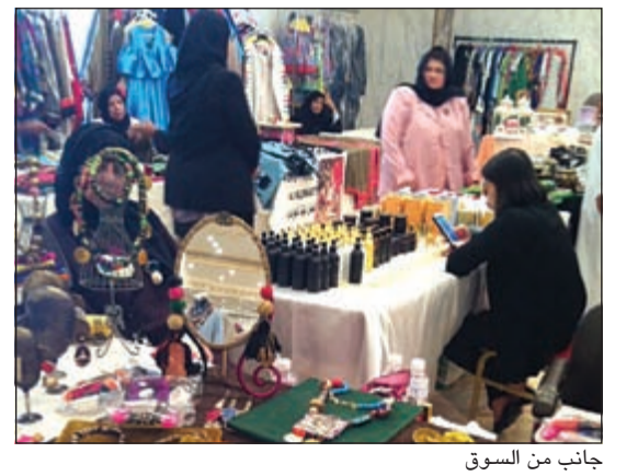
جانب من السوق