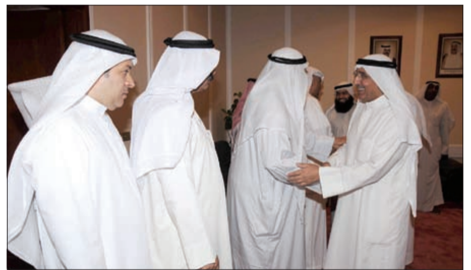
الوزير الجسار يتلقى التهنئة

فترة دراستها وتوجهاتها المرحلة بما يخص هذا الأمر، إلا أن الأهم أنه مهما كانت هذه التعرفة، ومهما كانت التوجهات في هذا الشأن فإنها حتما لن تمس ذوي الدخل المحدود. وتمنى ان يعينه المولى عز وجل على تحمل المسؤولية وتقديم كل ما هو خير لصالح الوطن والمواطن.