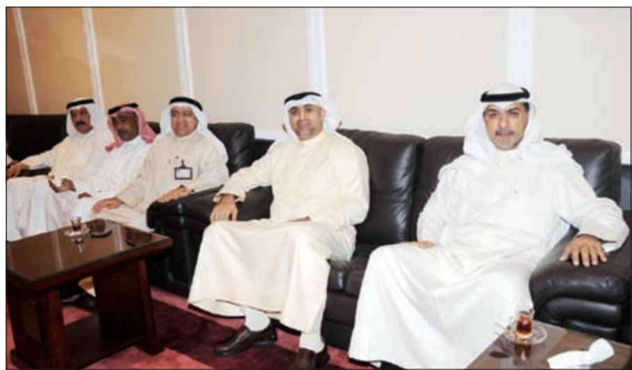
عدد من المهنيين