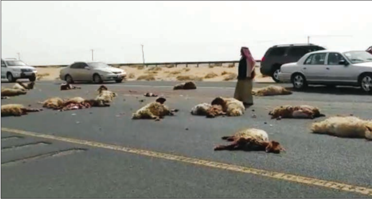
الخراف وقد تناثرت على الإسفلت بعد مصرعها