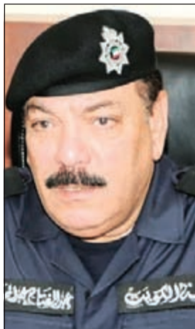
اللواء عبدالفتاح العلي