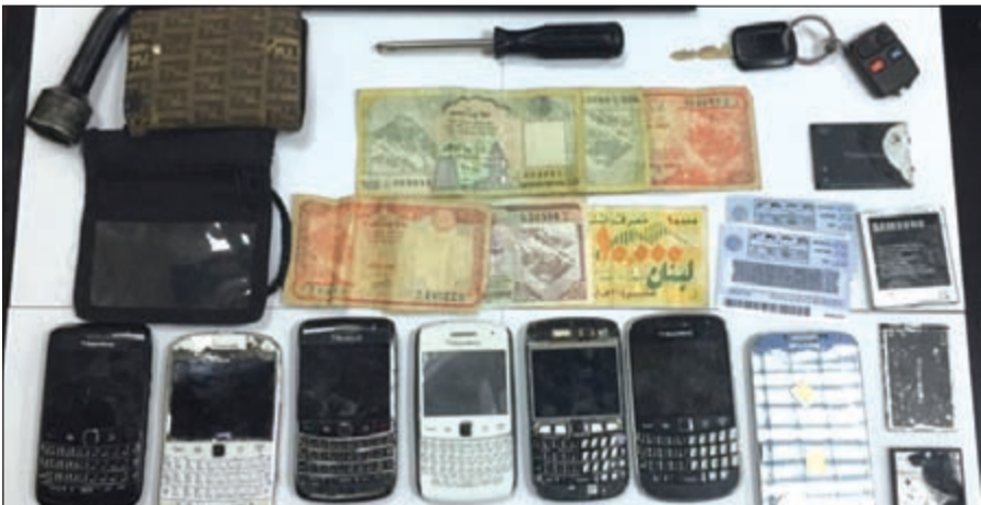
جانب من المضيوبات مع الوافد الاردني