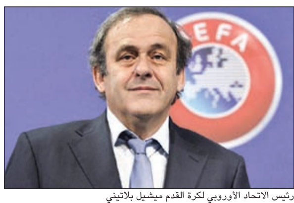
رئيس الاتحاد الأوروبي لكرة القدم ميشيل بلاتيني