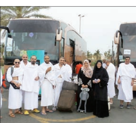
موظفو «زين» خلال استعدادهم لأداء مناسك العمرة

خارطة الطريق لحكومة المستقبل عام 2010 طرحت مقترحاً لتطبيق نظام تقييم الوظائف ونشرته في الصحف المحلية، بسبب ما رأيته من تكرار مطالبات نقابات الموظفين في أغلب الجهات الحكومية لتعديل رواتبهم ومنهم بدلات تتعلق بطبيعة عملهم وكان يساعدهم بعض أعضاء مجلس الأمة في الضغط على الحكومة والحصول على الموافقة وكانت أغلب الحالات تتم الموافقة عليها إذا لم تكن كل المطالبات، وهذا أعطى دافعا لنقابات أخرى وموظفي جهات حكومية لمزيد من المطالبات ويضعهم أضرب عن العمل وسبب مشاكل في أداء وتشغيل هذه الجهات الحكومية وكانت في النهاية توافق الحكومة على مطالبهم في زيادة رواتبهم وبدلاتهم مما أثر على ميزانية الباب الأول للمرتبم بالتضخم وأصبح يستغنى من 45 إلى 50٪ من ميزانية الدولة. ولهذا، الحل الوحيد لإنقاذ الدولة من الاستمرار في زيادات الرواتب والبدلات وتضخم الميزانية عشوائياً من دون أسس علمية ودراسات ميدانية ولوضع مسطرة واحدة لتحديد الرواتب للموظائف الحكومية في جميع الوزارات والهيئات والقطاع النفطي لا بد من تغيير النظام إلى سياسة رواتب تعتمد على توحيدها في جميع هذه الجهات وتهدف إلى زيادة الراتب مقابل كفاءة الأداء السنوي للموظفين وتوصيف وتقييم جميع وظائف الحكومة بنظام علمي واقعي مدرّوس يحدد أهمية وطبيعة عمل كل وظيفة مهما كان