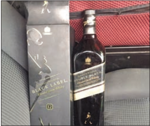
البطل المستورد في مركبة الهندي