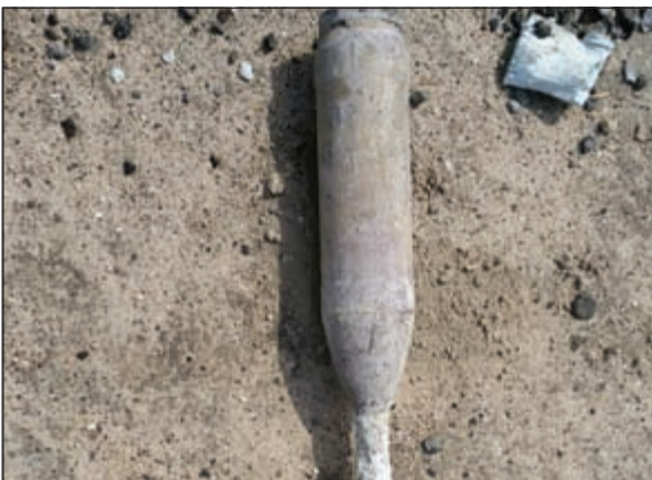
القذيفة تبين انها مورتز صوثية

كلف وكيل نيابة الفروانية رجال المباحث بضغط واحضار لصوص مجهولين يرجح ان