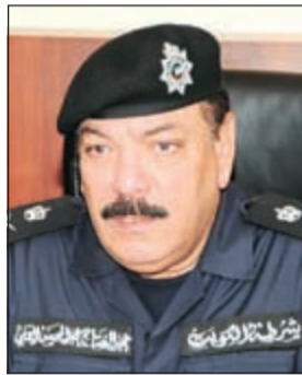
اللواء عبدالفتاح العلي

عن الأخرى يوصف قائدها بـ«الدجاجة»، أما السيارة التي تنطلق في طريقها دون انحراف فيلقب قائدها بـ«الديك».