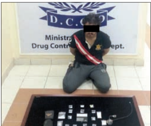
المضبوطات من الآيس أمام المواطن