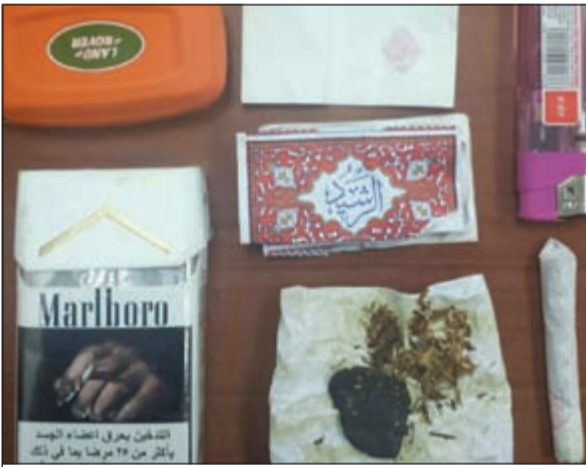
المضبوطات التي كشفت عنها الاغنية