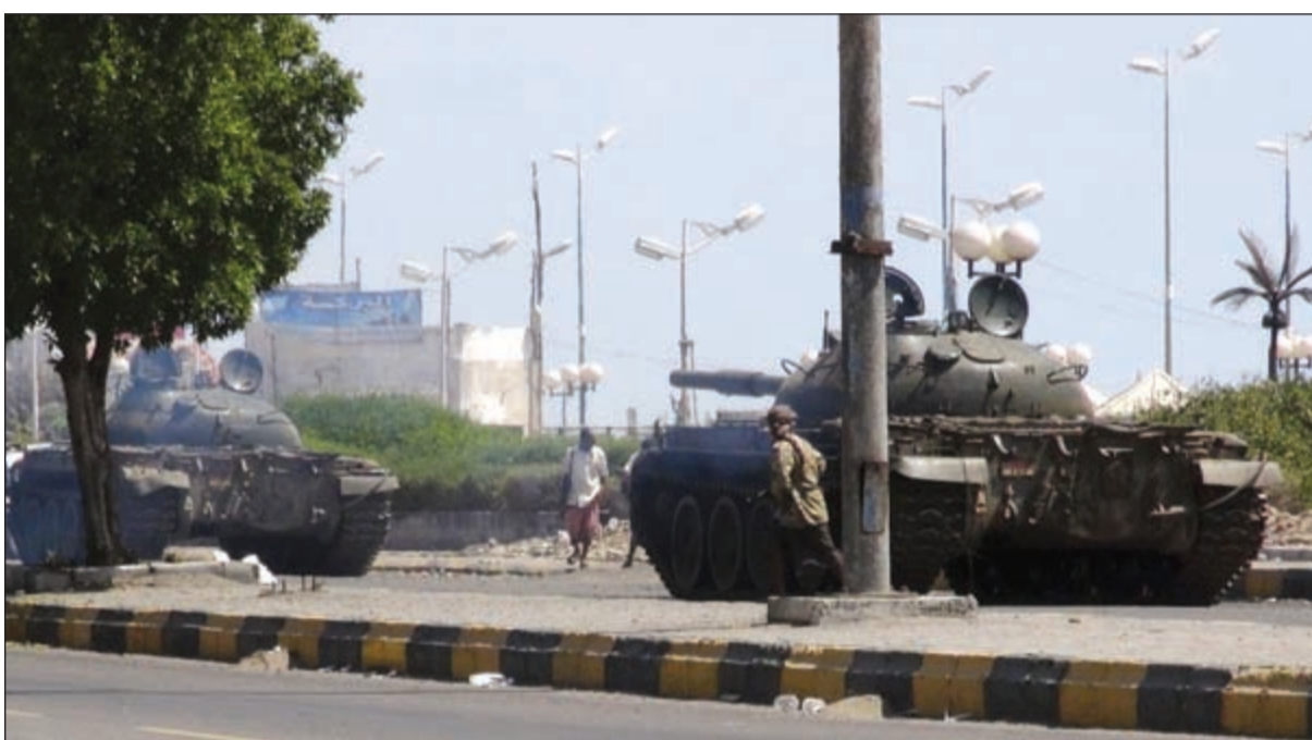
انتشار الدبابات حول مطار عدن الدولي بعد ان استعادته القوات الموالية للرئيس عبدربه منصور هادي

ويحاول هادي إحكام قبضته على عدن منذ أن فر إليها من صنعاء، فأمر بإقالة العميد عبد الحافظ السقايف قائد القوات الخاصة في المدينة وعين مكانه أحد ضباطه. لكن السقايف رفض تسليم