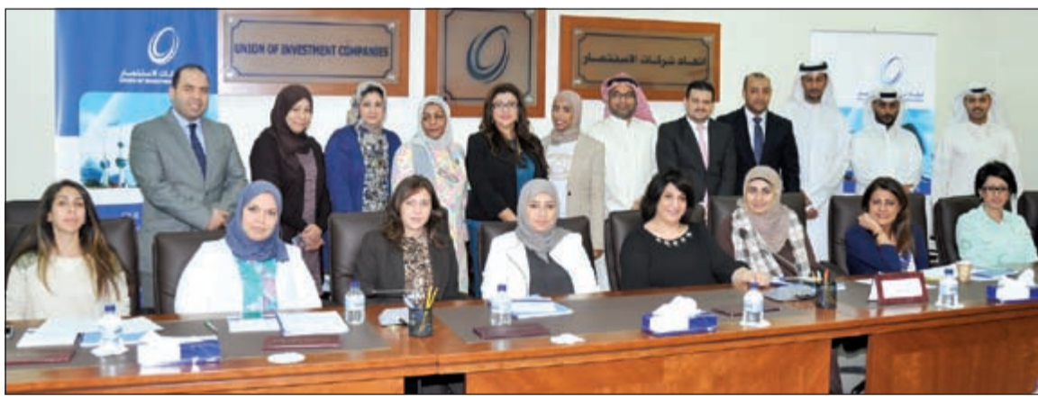
لقطة جماعية للمتدربين

المالي (كميفك) - شركة وفرة للاستثمار الدولي - شركة بيتك كابتال للاستثمار - شركة التمدين الاستثمارية - شركة المركز المالي الكويتي - شركة وفرة للاستثمار الدولي - شركة مجموعة الامتياز الاستثمارية - شركة ديمه كابتال للاستثمار - مجموعة أربان المالية للتطوير والاستثمار - شركة استراتيجيا للاستثمار.