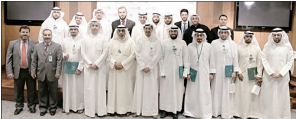
لقطة جماعية للمعمر مع الموظفين

وموظفة، وغطت البرامج التدريبية نحو 5000 موظف، كما غطى التعليم الإلكتروني نحو 1700 موظف، مشيرا إلى ان هذه الأرقام تؤكد على مدى التزام «بيتك» بتطوير وصقل مهارات موارد البشرية وذلك وفقا لأعلى المعايير وبأحدث الأدوات والأساليب. ودعا المعمر المتميزين إلى المثابرة والتفاني في العمل وبذل المزيد من الجهد والعطاء للحفاظ على ريادة المؤسسة وتحقيق النجاح والتطوير الوظيفية والإبداع كل في اختصاصه.