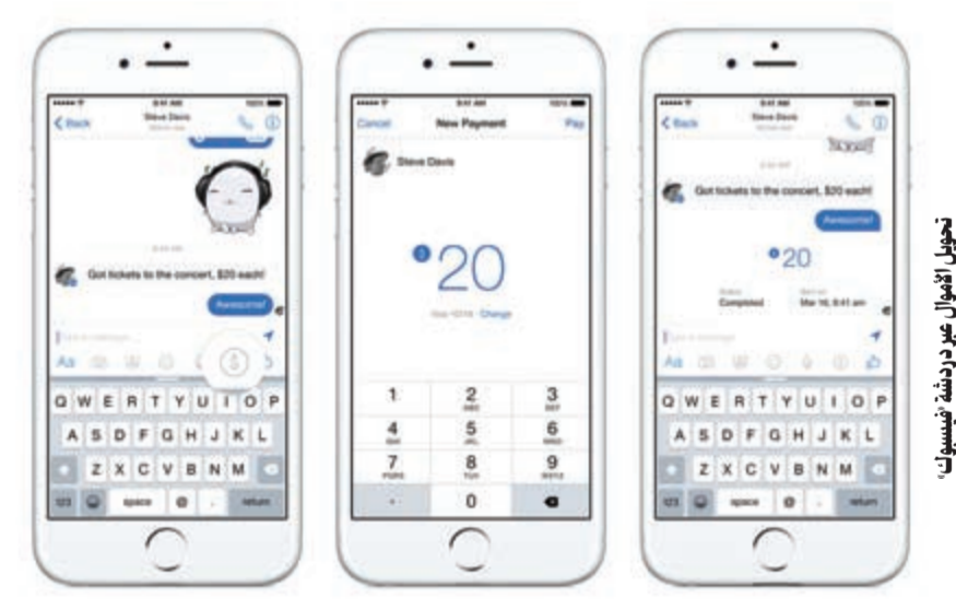
تحويل الأموال عبر منصة فيسبوك

بارسال الأموال إلى أصدقائهم وأسرهم باستخدام الهواتف الذكية المتصلة بالحسابات البنكية أو بطاقات الائتمان. ولإرسال الأموال، يضغط مستخدم ماسنجر على رمز جديد للدولار «$» بجانب الأزرار التي تمكن من إرسال الصور أو المصقات أو إشارات الإعجاب. وبعد ذلك يقوم المستخدم بإدخال المبلغ الذي يريد إرساله بالضبط على «ادفع» في أعلى الزاوية اليمنى ثم يدخل رقم بطاقته الائتمانية، ومن أجل الحصول على الأموال للمرة الأولى، يجب إدخال رقم البطاقة. وأشارت أن هذه الميزة ستساعد الشركة على مواكبة العديد من تطبيقات مواقع التواصل الاجتماعي الأخرى التي تسمح بتحويل الأموال بين الأصدقاء بما في Venmo، وSnapchat، وEBay التابع لـ PayPal.