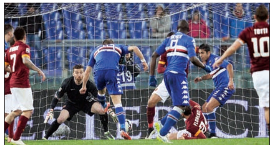
روما يواصل مستواه المتذبذب في الدوري الايطالي

رصيده الي 49 نقطة فتقدم بفارق 3 نقاط على نابولي، ويات على نقطة واحدة من روما وصيف البطل. على الملعب الاولمبي الكبير في تورينو، انتظر لاتسيو حتى الدقيقة 71 لافتتاح التسجيل عندما تلقى الأرجنتيني فيليبي اندرسون كرة من ماركو بارولو تابعها بيمنه في الشباك. وحسم اندرسون نفسه النتحية بتسجيله الهدف الثاني بعد تمريرة من الألماني المخضرم ميروسلاف كلوزه انهاها في سقف الزاوية اليسرى (78).