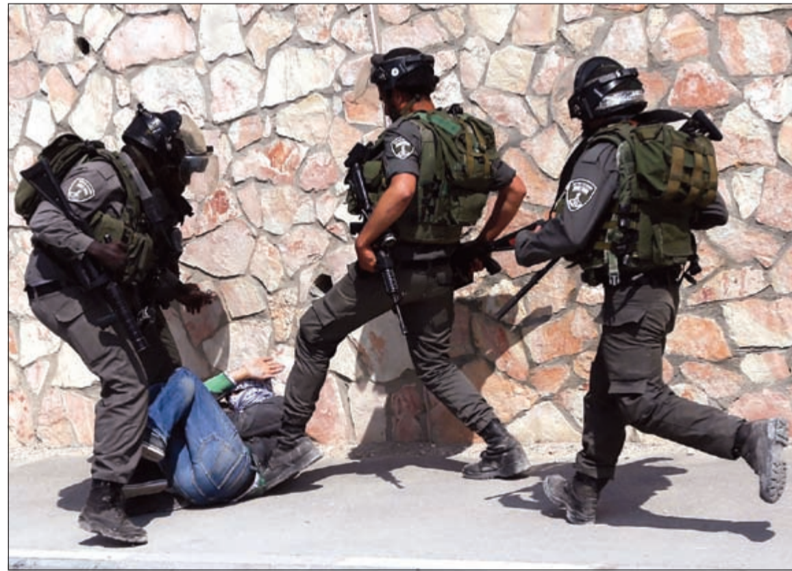
شرطة الاحتلال الاسرائيلي تمتدي على متظاهر فلسطيني قبل اعتقاله خلال تفريق مظاهرة بالتزامن مع الانتخابات البرلمانية

العرب سيخرجون للتصويت تحديا لنتنياهو هو... أما نتنياهو فقد رد باستجداء ناخبي اليمين ويث أس شريط فيديو على صفحته الرسمية على موقع فيسبوك يحذر فيه من اصوات العرب ويدعو فيه الإسرائيليين للتصويت له. وقال في الفيديو: «قوة اليمين في خطر. الناخبون العرب يتجهون بشكل حاشد إلى صناديق الاقتراع». وأضاف: «المنظمات غير الحكومية اليسارية توفر حافلات لهم. لدينا اتم فقط. انهبوا إلى مراكز الاقتراع واجلبوا عائلاتكم وأصدقائكم وقوموا بالتصويت لليهود لإغلاق الفجوة بيننا وبين حزب العمل». بدوره دعا وزير الخارجية أفيغدور ليبرمان