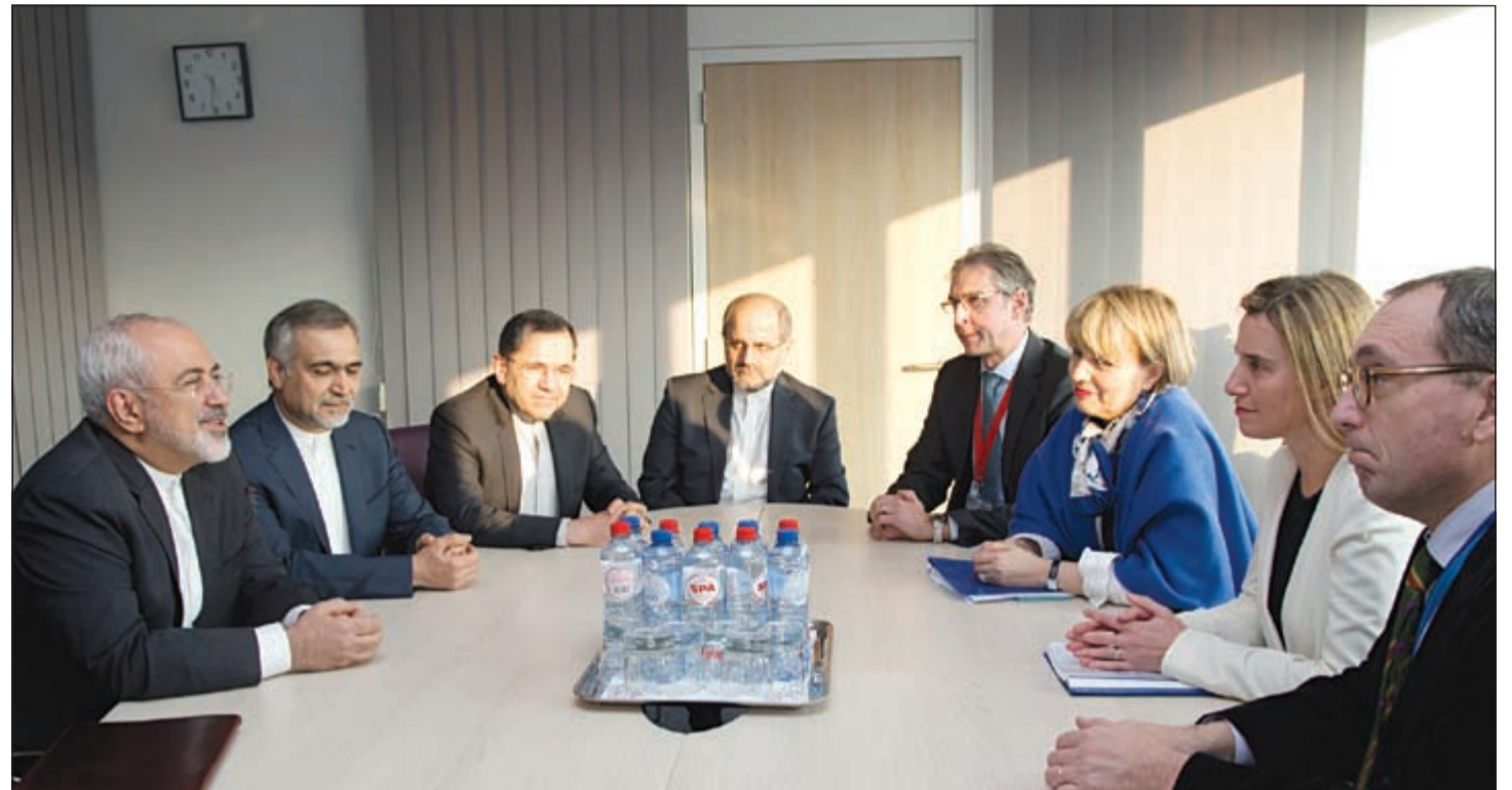
جانب من الاجتماع بين وزير الخارجية الإيراني ونظرائه الأوروبيين في بروكسل أمس الأول

وقال جوش إيرنست «بالنسبة إلى الرئيس، فإن الاحتمال لم يتغير»، موضحا أن فرص التوصل إلى هذا الاتفاق هي «50% في أفضل الأحوال»، وذلك ردا على سؤال عن تصريحات المسؤول الإيراني. في نفس السياق قال مسؤول أميركي كبير أمس إن إيران والقوى العالمية الكبرى حققت تقدما في تحديد خيارات فنية قد تشكل أساس اتفاق نووي طويل الأجل لكن لا تزال هناك قضايا صعبة يجب تناولها. وأضاف المسؤول الذي طلب عدم ذكر اسمه للصحافيين «حققنا حتما تقدما فيما يتعلق بتحديد الخيارات الفنية في كل المجالات الرئيسية. لا