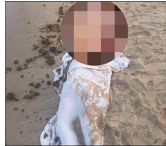
جثة الأسوي بعد انتشالها من الماء

أحيلت جثة وأحد أسوي إلى الطب الشرعي أمس لمعرفة حقيقة وفاته على وجه التحديد، وما إذا كان قد مات غرقاً أم قتل والقي في البحر. وبحسب مصدر أممي، فإن عمليات الداخلية أبلغت عن وجود جثة طافية مقابل شاطئ الفحيحيل، وعلى الفور توجه رجال الإطفاء وانتشلوا الجثة، ومن ثم أحيلت إلى الطب الشرعي، وتمكن الطب الشرعي مبدئياً من تحديد هوية الوافد من خلال البصمة، وتبين أن أصدقاء له أبلغوا عن اختفائه خلال السباحة، ورجحوا أن يكون قد انتحر.