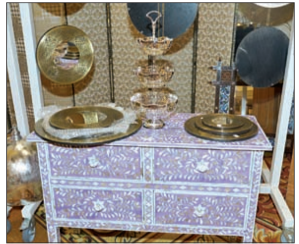
أطباق تقديم مميزة