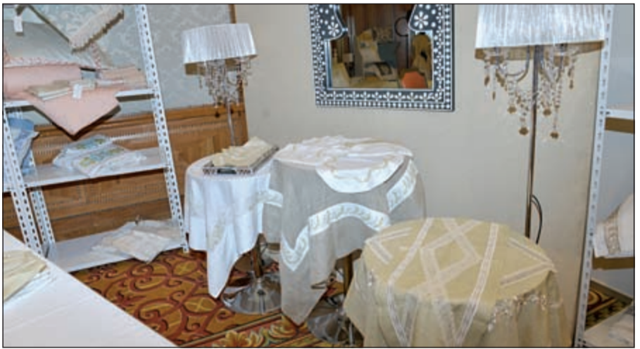
جناح خاص للمفارش

قانون جمعيات النفع العام يدرس حاليا في «الفتوى والتشريع» تمهيدا لعرضه على مجلس الوزراء ثم مجلس الأمة