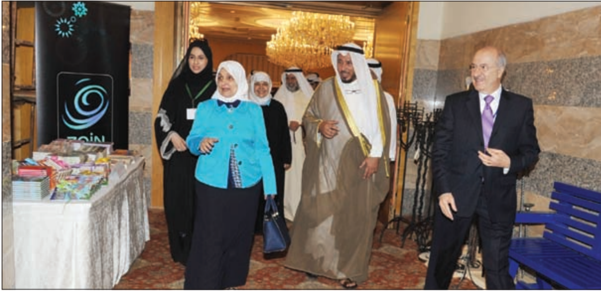
الوزيرة الصبيح و.عبدالله المعنوق خلال جولة في المعرض (قاسم باشا)