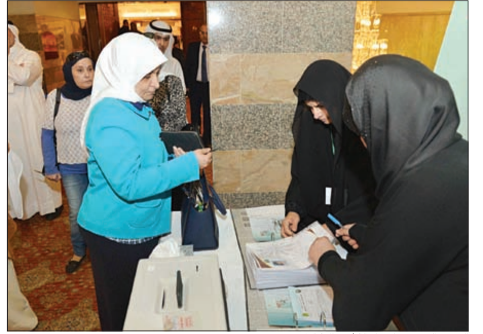
الوزيرة الصبيح تجار بكفالة أحد طلبة العلم