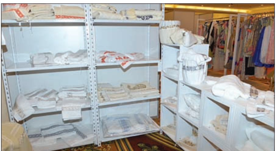
من المنتجات المتميزة