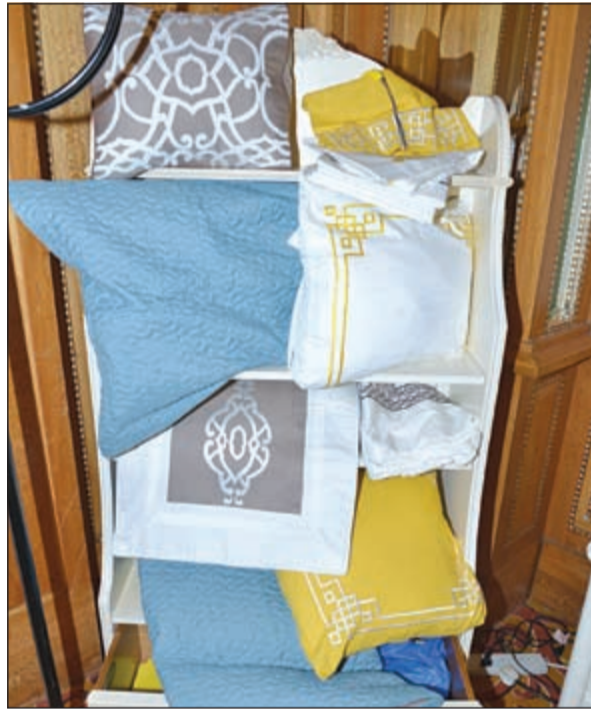
أغطية مميزة للوسادات