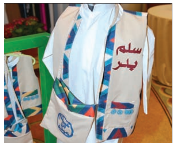
ملابس تراثية للأطفال