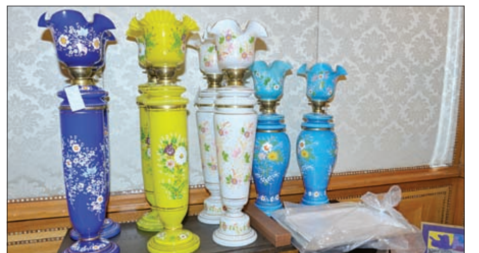
من إبداعات الشباب