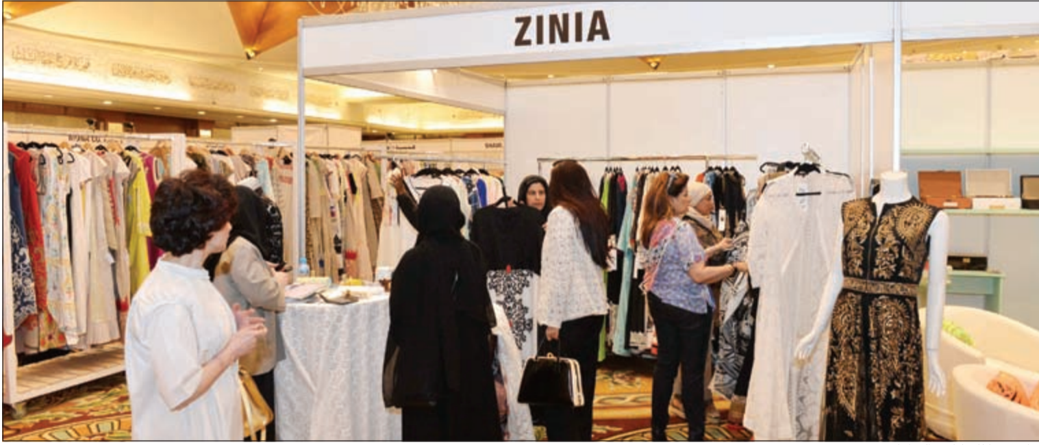
جناح زينيا للعباءات والدرعات