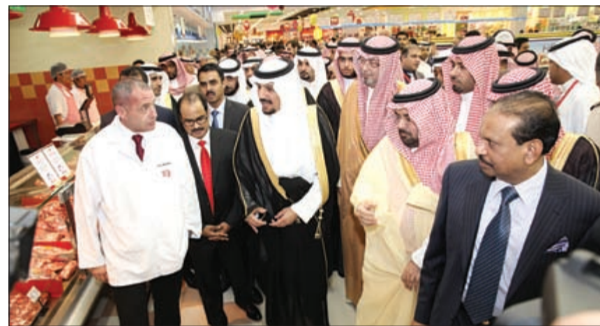
جانب من افتتاح لولو هايبر ماركت في مدينة الجبيل