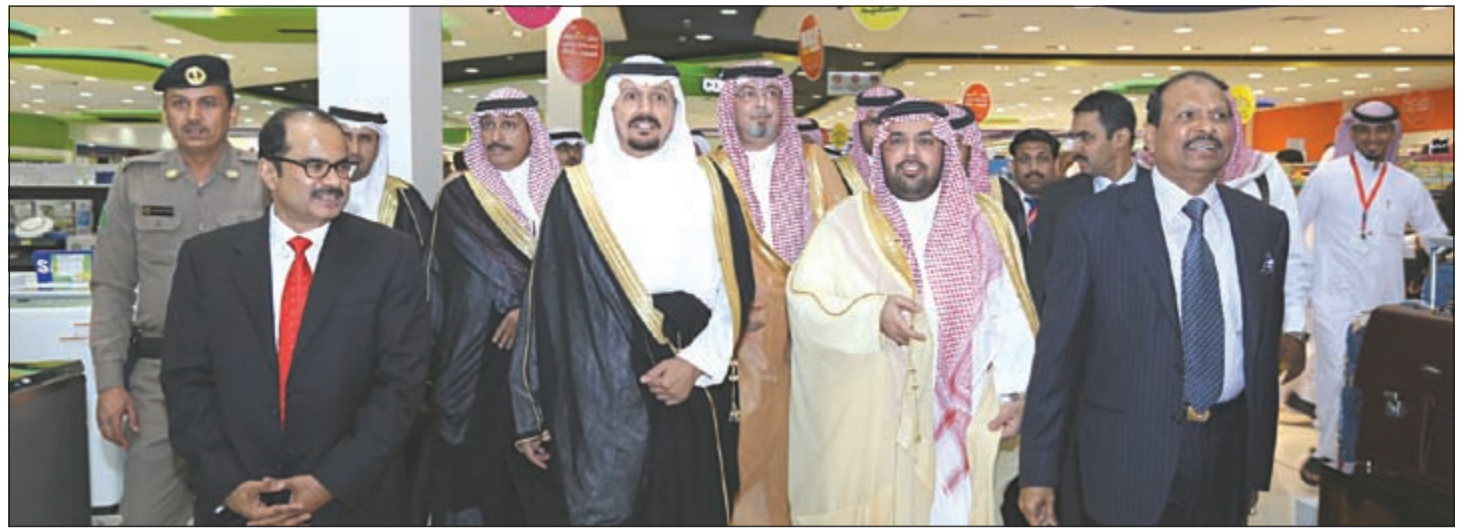
جولة في لولو هايبر ماركت - الجبيل