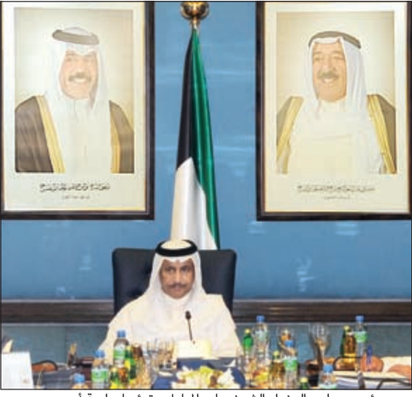
سمو رئيس مجلس الوزراء الشيخ جابر المبارك مترئسا جلسة أمس

صباح الأحد. ثم بحث المجلس شؤون مجلس الأمة، وأطلع في هذا الصدد على الموضوعات المدرجة على جدول أعمال جلسة مجلس الأمة. كما بحث المجلس الشؤون السياسية في ضوء التقارير المتعلقة بمجمل التطورات الراهنة في الساحة السياسية على الصعيدين العربي والدولي.